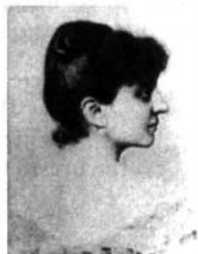
FIG. 8. Prințesa Elena Bibescu

Apreciată ca "vice-mamă" a lui George Enescu, alături de regina Carmen-Sylva, marea pianistă Elena Bibescu 12 a ținut la Paris, timp de un sfert de secol, un salon în care invitații obișnuiți erau: Franz Liszt (1811-1886).