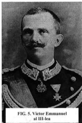
FIG. 5. Victor Emmanuel al III-lea

De aici, probabil aflat în regim de anticariat (?) a fost achiziționat de o persoană iubitoare a operei lui Puccini sau a Casei Regale de Savoia. Elena de Muntenegru 9 , personalitate marcantă a epocii sale (Regină a Italiei și Albaniei, Împărăteasă a Etiopiei), fiică a lui Nicolae I de Muntenegru, s-a născut la 8 ianuarie 1873 la Cetinje, Muntenegru și a decedat la 28 noiembrie 1952 (79 ani) la Montpellier, Franța. Soție a lui Victor Emmanuel al III-lea (fig. 5), 11 noiembrie 1869-28 decembrie 1947 (Rege al Italiei 29.07.1900-09.05.1946; Rege al Albaniei 1939-1943; Împărat al Etiopiei 1936-1941).