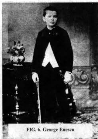
FIG. 6. George Enescu