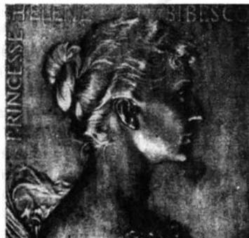
FIG. 8a. Plachetă din bronz (81 x 92 mm)

Natura împrejurărilor de altădată mi-a permis să reamintesc câteva momente importante despre cel care pentru memoria sa era comparat cu istoricul Nicolae Iorga iar despre muzică, chiar el însuși spunea: “Muzica este o satisfacere a spiritului, liniștea lui, dacă se poate. Ea nu vrea decât evocări de stări afective; iar, în cazurile mai abstracte, o anumită stare afectivă, în legătură strânsă cu sentimentul problemei ce se pune” 16 . Insistența mea în acest sens a avut în vedere și prezentarea pe scurt a celor două piese medalistice de o frumusețe și importanță deosebită pentru mai toți iubitorii de muzică și pentru cel ce s-a stins din viață în ziua de 4 mai 1955, departe de țara lui dragă, pe care dorise din suflet s-o mai revadă o dată.