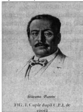
Giacomo Puccini FIG. 1. Copie după C.P.I. de epoca

Cu toate că tânărul Giacomo nu a fost nici pe departe un copil minune 2 , a semnalat suficient talent, încât a reușit admiterea la Conservatorul din Milano (1880) cu un strălucitor succes. Remarcat în acest sens, a beneficiat de o bursă excepțională din partea reginei Elena a Italiei, studiind până în 1883 când și-a obținut diploma cu "Capriciu simfonic" 3 , având ca profesori pe Ponchiello și Bazzini. Hotărârea lui de a se consacra teatrului a fost luată în 1876, când la Pisa a fost puternic marcat de o reprezentație cu Aida de G. Verdi.