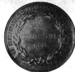
FIG. 7. Medalia de la absolvirea Conservatorului din Viena - 1893