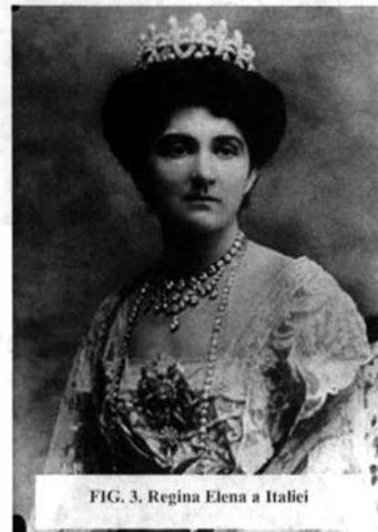
FIG. 3. Regina Elena a Italiei