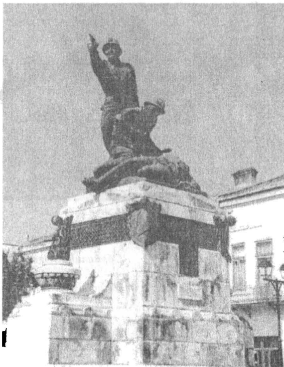
Monumentul „COMPANIA DE MITRALIERE MAIOR GRIGORE IGNAT”