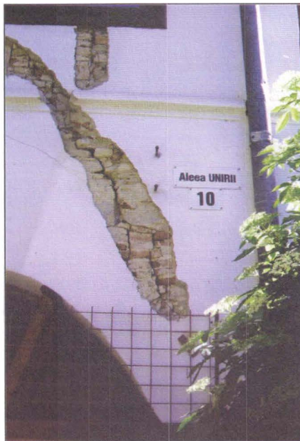
CASA „MANOLACHI IORGA – SAINT-GEORGES” în anul 2012