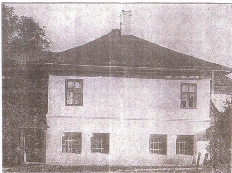
Casa „Manolachi Iorga”, devenită „SAINT-GEORGES” pe la sfârșitul secolului al XIX-lea. Foto din Neamul românesc literar , Anul II, Nr. 1, 3 ianuarie 1910 (aflată la 200 m de BISERICA „CUVIOASA PARASCHEVA”)