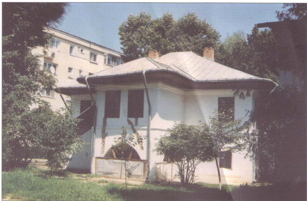
Casa „Manolachi Iorga - Saint-Georges” după desființarea expoziției etnografice în anul 2007 http://www.cimec.ro / http://www.muzeubt.ro