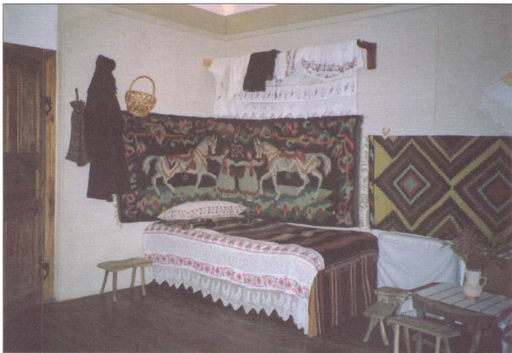
Imagine din interiorul Muzeului Etnografic Botoșani (din perioada 1989 - 2007)