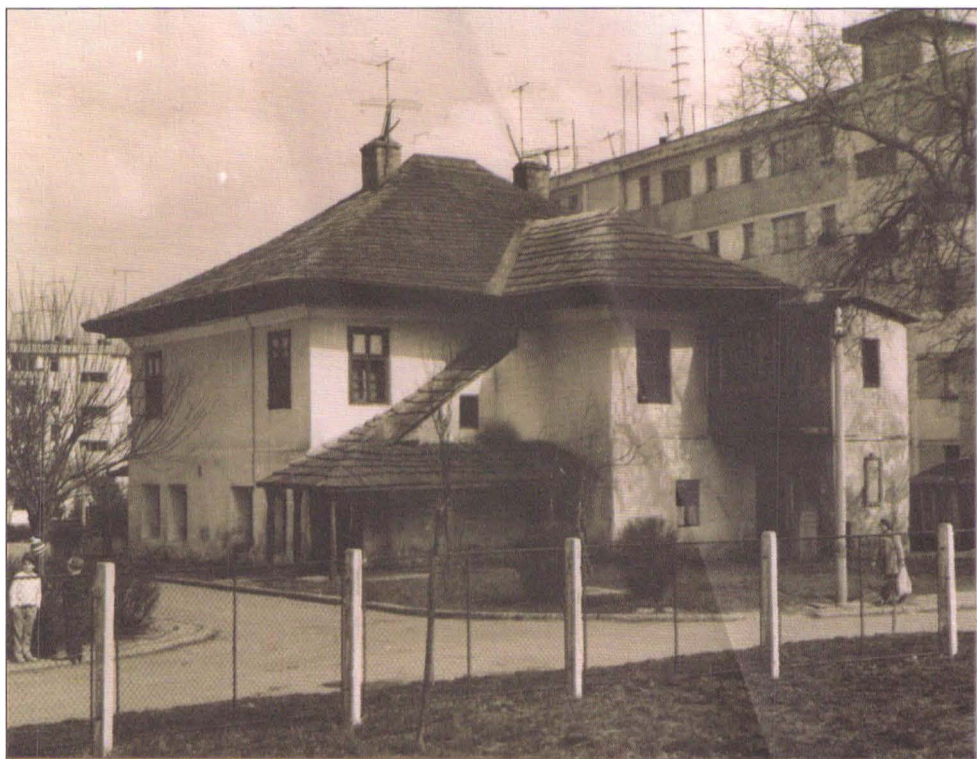
Casa „Manolachi Iorga – Saint-Georges” (înainte de restaurare – an 1979; acoperită cu șindriță)