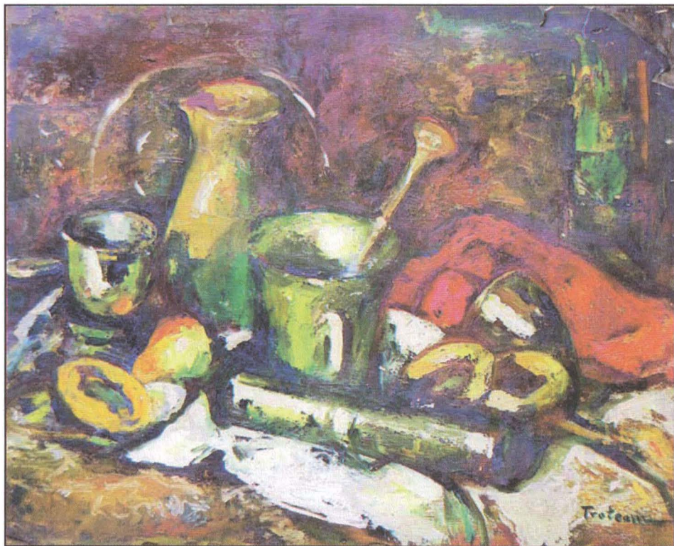
Fig. 1- Petre Remus Troteanu – Natură statică cu căni