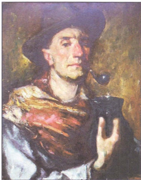
Fig. 3 - Petre Remus Troteanu Autoportret cu pipă