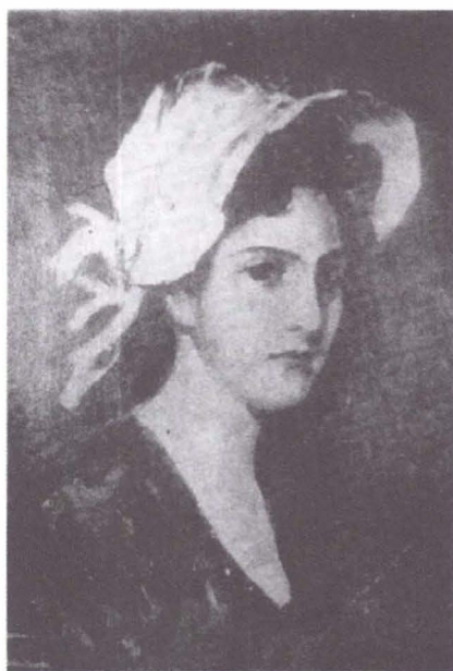
Fig. 4 - Afișul Expoziției Retrospective Petru Troteanu