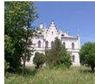
Palatul Familiei Cuza de la Ruginoasa - Iași