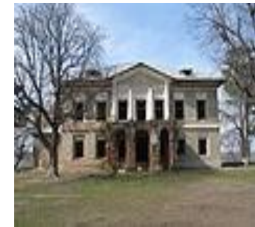
Conacul Rosetti - Solescu de la Solești - Vaslui