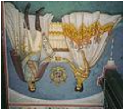
Alexandru Ioan și Elena Cuza - citorii bisericii de la Ruginoasa