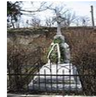
Mormântul Elenei Cuza de la Solești - Vaslui