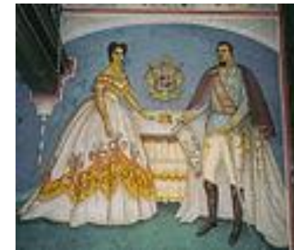
Alexandru Ioan și Elena Cuza - citorii bisericii de la Ruginoasa