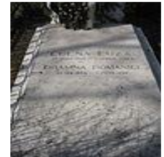
Piatra funerară de pe mormântul Elenei Cuza