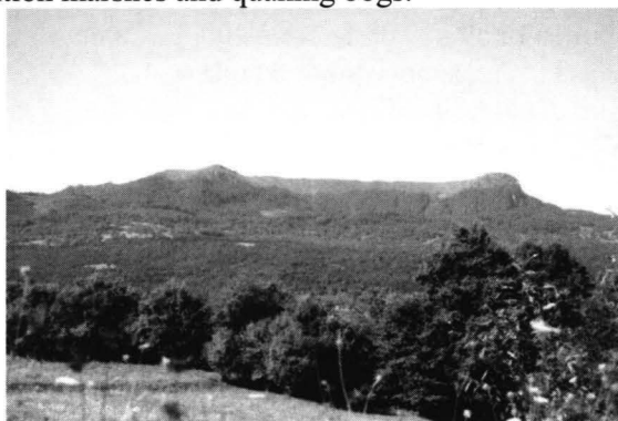
Munţii Gutâi (Vf. Gutâiul Mic 1392m (Cei trei Apostoli, Pietrele Armenilor) – Vf. Gutâi 1443m - Creasta Cocoşului)

In the Habitats Directive and the Government Law no. 57/20.06.2007, this area corresponds to community interest habitat whose conservation requires the denomination by Special Areas of Conservation, code 7140 - Transition marshes and quaking bogs.