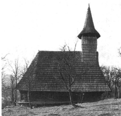
Biserica din Sârbi Susani, latura de nord, aprilie 1995

Biserica de lemn Sfânta Paraschiva din Susani în satul Sârbi, Maramureș, a fost construită din lemn de stejar în jurul anului 1639. Deși nu este cea mai veche din Maramureș, biserica de lemn din Sârbi Susani păstrează câteva din trăsăturile cele mai arhaice din arhitectura sacrală de lemn românească. Valoarea deosebită a acestui monument, care în fapt depășește chiar pe cea a suratelor înscrise în patrimoniul mondial, constă în conservarea portalului de