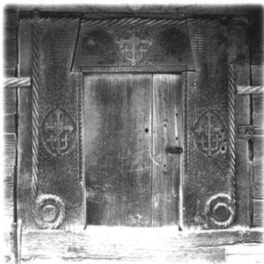
Portalul de la intrare, foto 1995

Turnul bisericii nu este ridicat odată cu biserica, fiind adăugat ulterior, cel mai probabil în a doua jumătate a secolului 17, când turnul se generalizează în arhitectura sacrală din Maramureș. Turnul acesta este foarte îngust la bază și, în mod surprinzător, se lărgeste la șatra (foișorul) clopotelor. Cornii vechi ai coifului, dimensionați după lățimea bisericii, lungi de 2 stâneni regali, au fost aruncați în foc și înlocuiți cu alții mai noi în anul 2000, de aici coiful ținut față de cel precedent. 29