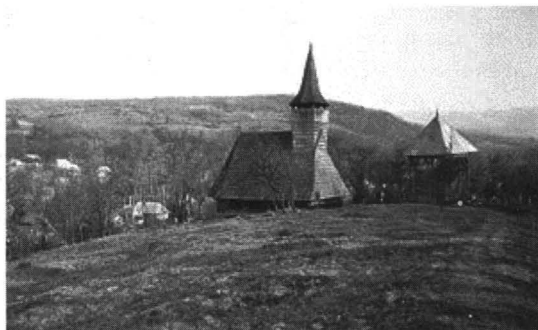
Pe drumul vechi spre biserică și clopotniță, foto 1995

Biserica este așezată pe un platou deasupra văii Cosăului. Pe un drum de care, printre garduri împletite de nulele, se merge până la o poartă de fier care a înlocuit-o pe cea veche de lemn. O porțiță de lemn pe doi stâlpi, protejată de un mic acoperiș, a fost parțial salvată în muzeul din Sighet. Sculptura ei este