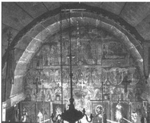
Tâmpla pictată de Alexandru Ponehalschi în 1760, foto 1995

maramureșene. 8 Alexandru Baboș a făcut o descriere a construcției, susținută cu relevee detaliate, într-un studiu dedicat bisericilor de lemn cu o singură streășină din Maramureș. 9 Biserica a fost datată dendrocronologic în 1997. 10 Într-un studiu ulterior Alexandru Baboș a publicat releveele ușii, ferestrei decorate, prestolului și a analizat trăsăturile constructive fundamentale ale lăcașului. 11