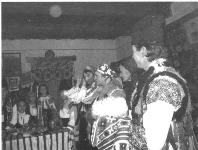
Orația colacului, Idicel Sat, 2006

Pregătirea gazdelor în vederea primirii colindătorilor are loc cu o săptămîină înainte și constă în procurarea alimentelor necesare preparării bucatelor, curățirea curții și a întregii gospodării. Pregătirile culminau în cele două zile anterioare sărbătorii, când se cocea în cuptor, cînd se pregăteau mîncărurile și darurile pentru colindători.