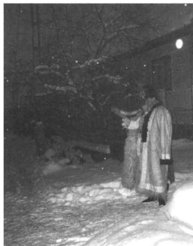
Chemarea feciorilor cu buciumul la gazda turcii