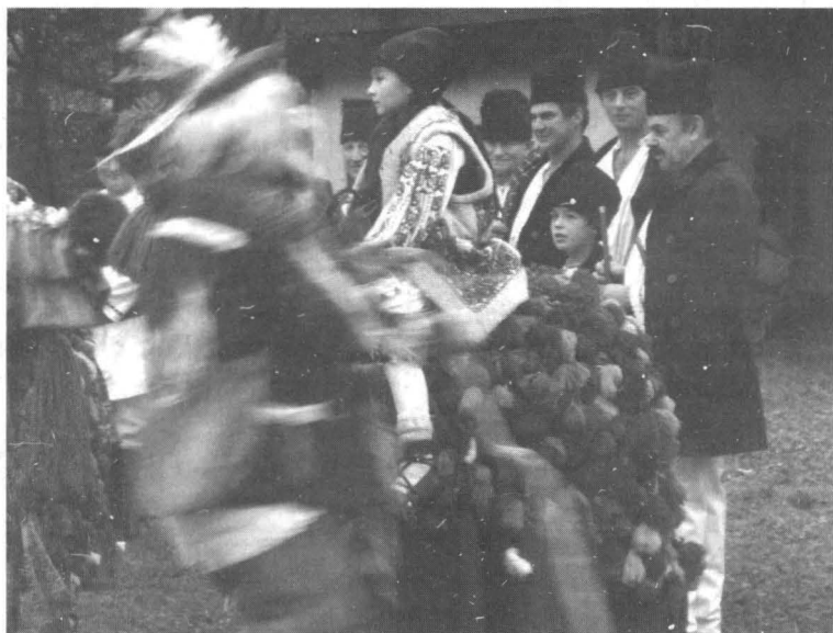
Colinda fetei, Idicel Pădure, 2008

„Ce-ntrebați, voi, mari boieri, Florile-s flori dalbe de măr, Că Măriuca, fată dalbă, N-are lucru ce lucra, Da ea coasă, chideșește Guler la tăfîne-său Și unu frăție-său, Noi umblăm s-o colindăm