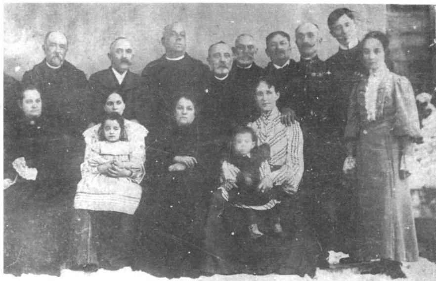
Vasile Lucaciu la un botez la Baia Sprie alături de preoți din împrejurimi (circa 1910)

Moldovan, precum și un țăran credincios din Șișești, în numele fiilor credincioși ai marelui preot, care i-a condus la pășunea cea adevărată o jumătate de veac. Osemintele au fost așezate în groapa săpată înaintea altarului, unde se ruga pentru poporeni și pentru neamul întreg.”