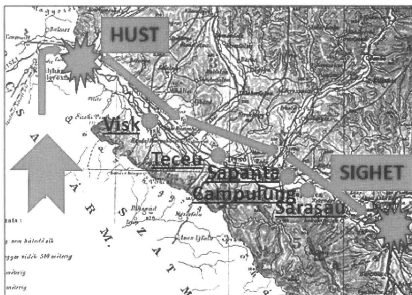
1661. Incursiunea turco-tătară de la Hust la Sighet