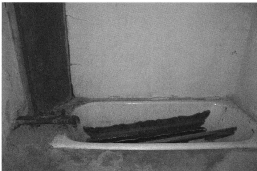
Foto 5- Interior, cadă de baie