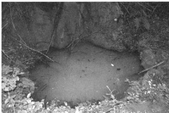
Foto 2- Izvorul mineral nr. 2

Izvorul nr. 2 este amplasat pe partea stângă a văii, la 2 m amonte de primul izvor, și este captat într-o fântână săpată în versant, lângă vale. Are 2,7m lungime, 2,5m lățime iar adâncimea apei minerale este de 80 cm (foto 2). Coordonate GPS: N 47 49 29,9 - E 24 14 21,6, altitudinea 436 m. Apa minerală este sulfuroasă și are pH 6-6.5.