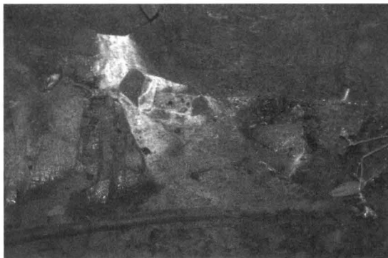
Foto 1- Izvorul mineral nr. 1

Izvorul nr. 1 este amplasat pe partea dreaptă a văii și este captat într-o fântână săpată în versant, lângă vale și are 1,8m lungime, 1,7m lățime iar adâncimea apei minerale este de 20 cm (foto 1). Apa minerală este sulfuroasă și are pH 6.5-7.