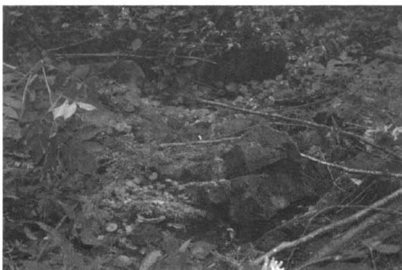
Foto 3- Fundația din piatră a vechilor băi