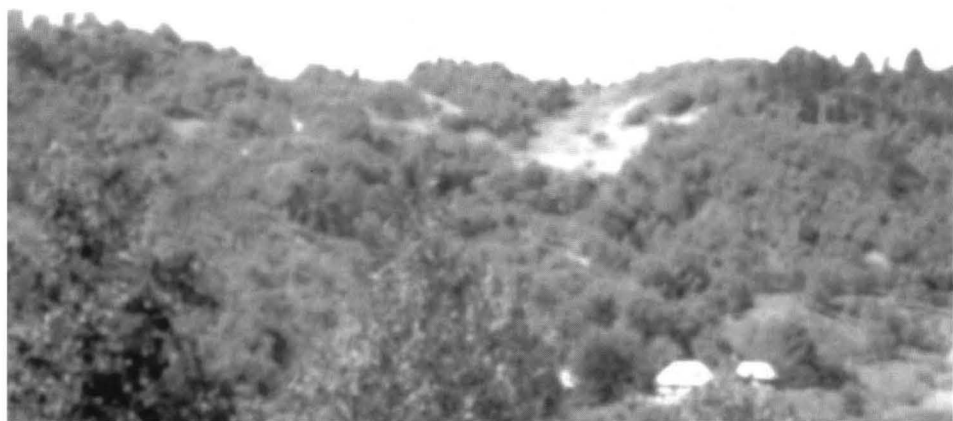
Coasta lui Moșică și Lapte Gros de la Iapa