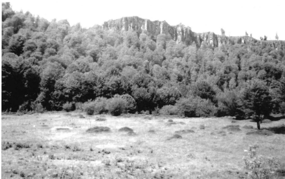
Piemontul Piatra Goală de la Iapa