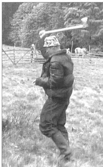
Fig. 2. Păcurarul înfige secura în pământ în fața strungilor;