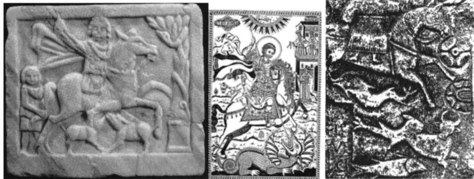
Fig. 6. Reprezentări mitice geto-dace, celte și românești. Stânga: Cavaleul trac 61 ; Centru: Sf. Gheorghe 62 ; Dreapta: zeița celtă Epona 63

Sângeorz, Sâmedru și Sântoaderul cel Mare sunt divinități pastorale de origine indo-europeană. Cu toții purifică spațiul de forțele malefice sau omoară balaurul. În Panteonul românesc Sângeorz este identificat cu Cavalerul Trac. După opinia lui Ion Ghinoiu Cavalerul Trac cioplit în piatră este identic cu celebra icoană a Sfântului Gheorghe; amândouă reprezentările mitice sunt călare pe cai și au în mână aceeași armă de luptă, sulița (fig. 6).