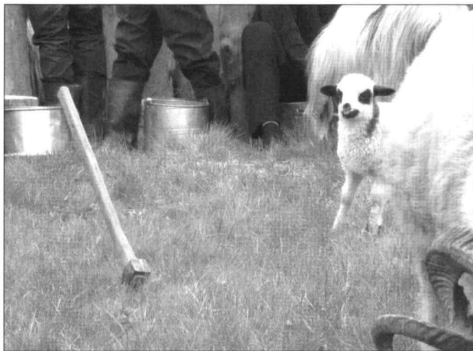
Fig.3. Toporul la Ruptu' Sterpelor ; foto Ciprian Coc, 2014

Toporul simbolizează fulgerul, la fel ca săgeata, tridentul sau ciocanul. În toate culturile securea este asociată cu fulgerul și, deci cu ploaia – ceea ce ne îndreaptă spre simbolurile fertilității. Despicing Pământul și intrând în el figurează uniunea acestuia cu Cerul: ceea ce desparte poate să și unească. 23