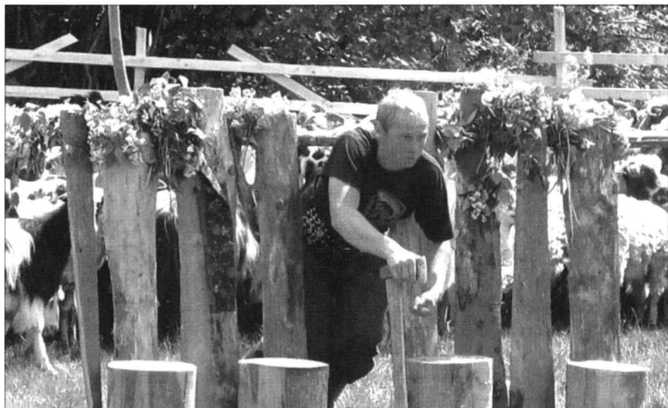
Fig. 1 Păcurarul iese prin strungi cu topor și cu sare ; foto: Ciprian Coc, 2014

implântă în gura fiarelor în pământ să nu poată sări la iele” 9 ; „și trebe să înfigi toporu’ înaintea strungilor, un singur topor, de protecție. Un fel de credință dar și protejare, un fel de spirit” 10 .