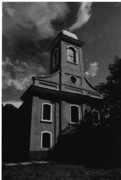
Biserica Ortodoxă Ucraineană