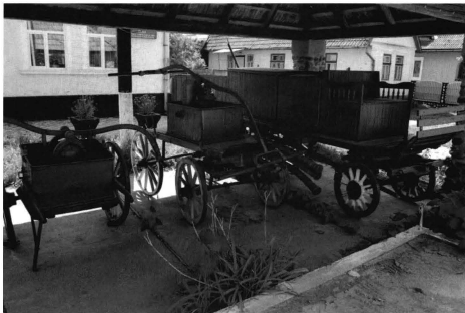
Instalații de stingerea incendiilor de la începutul sec. XX