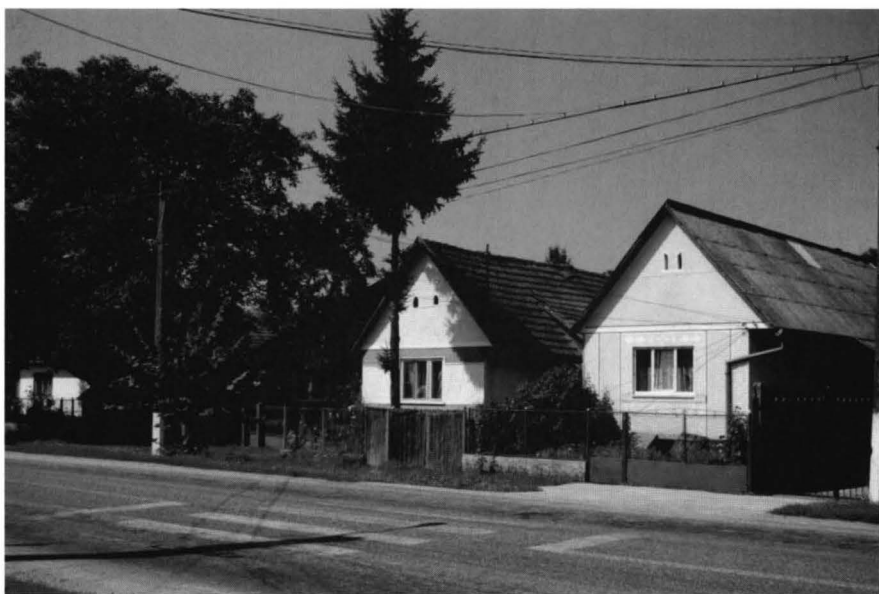
Case tradiționale, specifice comunității maghiare