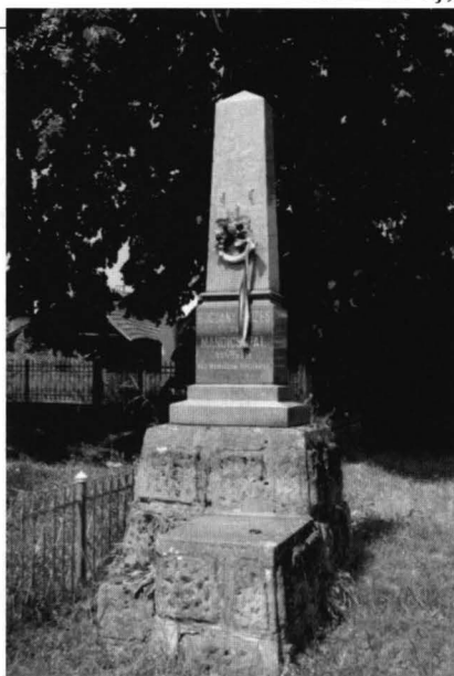
Obeliscul Eroilor Revoluției de la 1848 – 1849