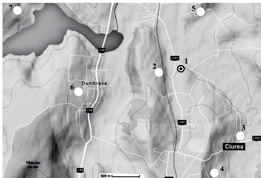
Fig. 1. Harta satului Ciurea și a localităților din jur unde s-au identificat așezări aparținând epocilor Hallstatt și La Tène: 1. punctul unde s-a descoperit ceașca; 2. „La Canton“; 3. „Tinoasa“; 4. „Botu Cihanului“; 5. Cimitirul fostului sat Zanea; 6. Dumbrava; 7. Cetatea de la Ciurbești.