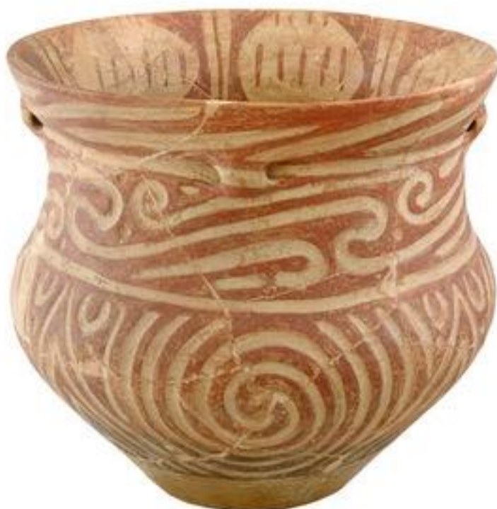
Fig. 15. Vas crater de la Drăgușeni-Ostrov (Nr. Inv. 781).