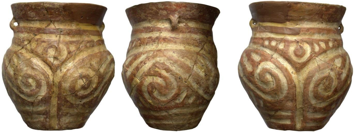
Fig. 4. Vas antropomorf descoperit la Dragușeni-Lutărie (Nr. inv. 753).