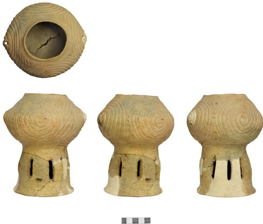
Fig. 9. Vas antropomorf descoperit la Mitoc-Pârâul lui Istrate (Nr. inv. 6628).