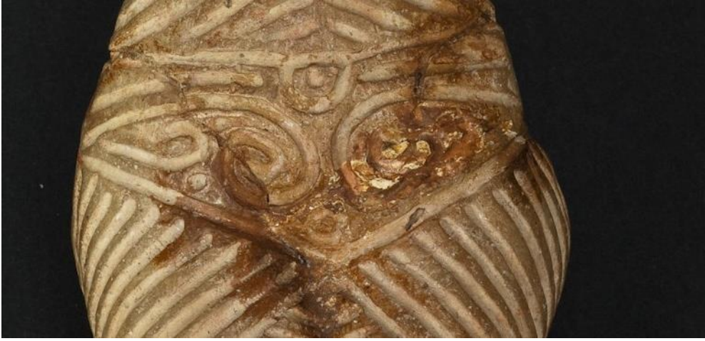
Fig. 16. Centura statuetei „Venus de la Drăgușeni”.