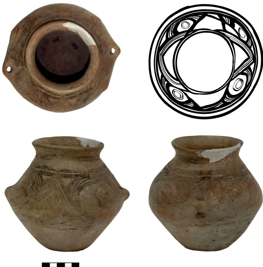
Fig. 12. Vas antropomorf descoperit la Cervicești Deal-La Mărișcă (Nr. Inv. 6936).