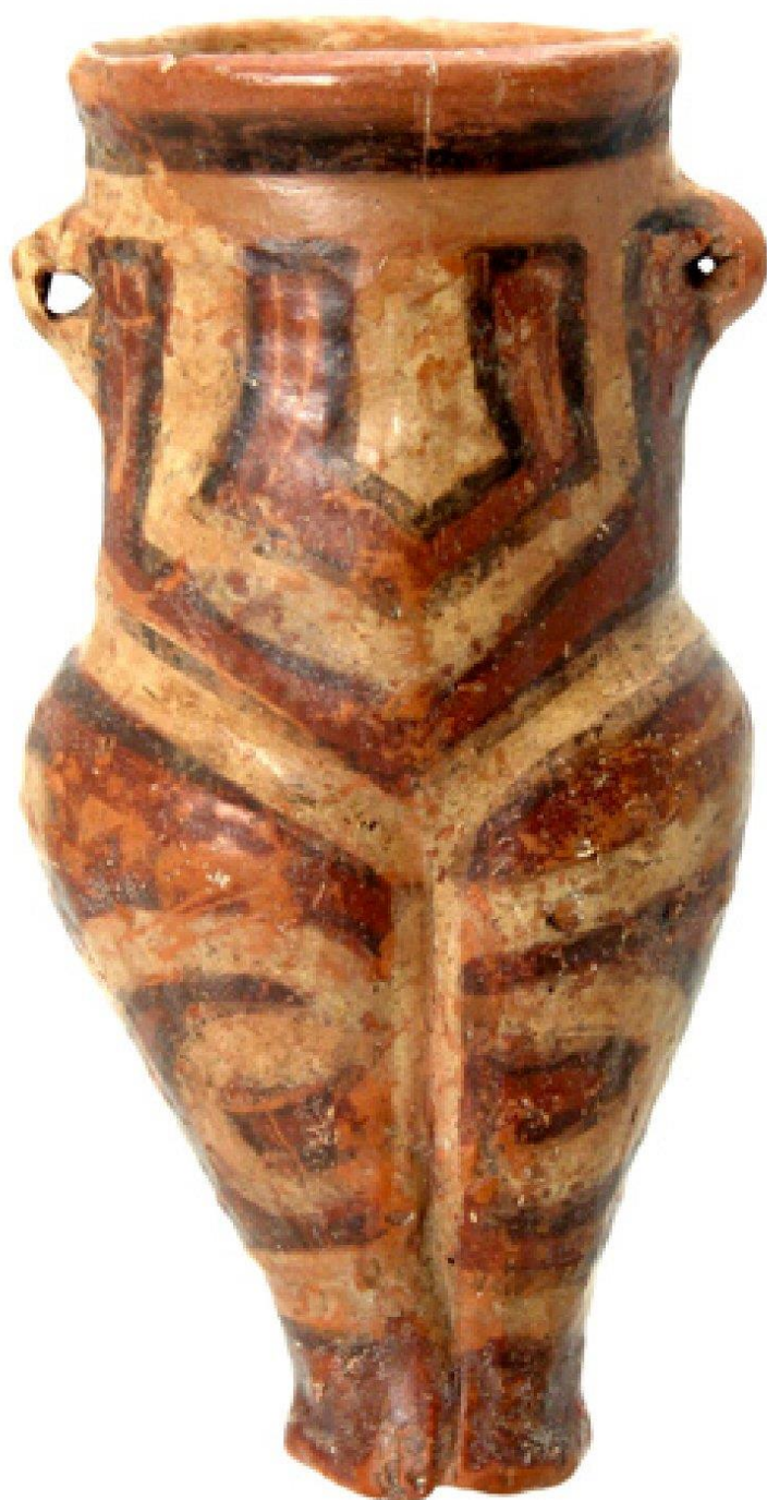
Fig. 13. Vas antropomorf de la Scânteia-Dealul Bodești (C. M. Lazarovici, Gh. Lazarovici, S. Țurcanu, 2009, 185, cat no. 153).