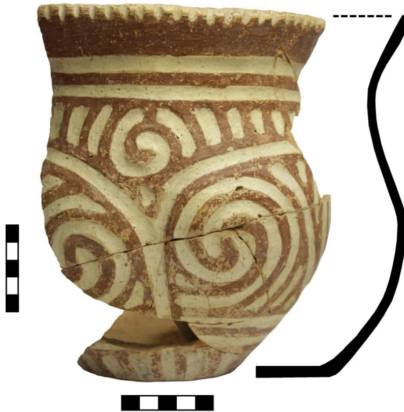
Fig. 5. Vas antropomorf descoperit la Draguseni-Lutărie în Groapa 10/1964 (neinventariat).