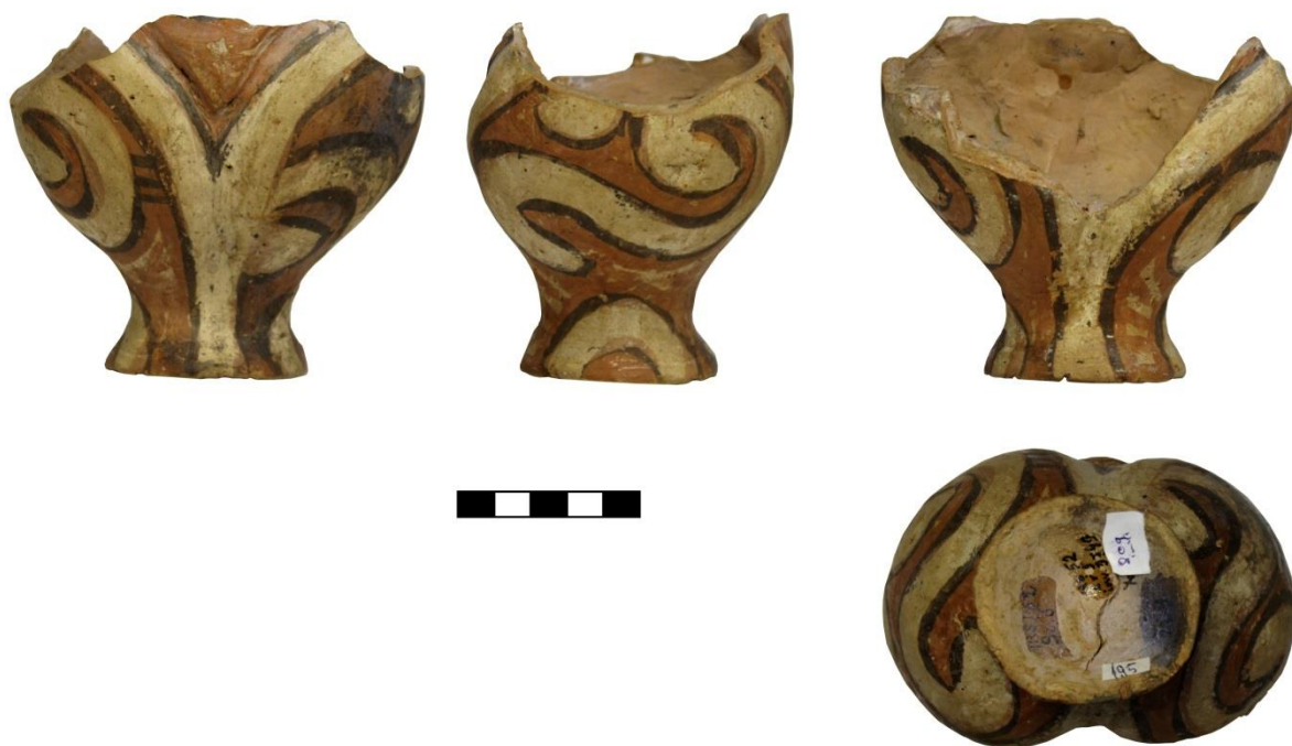
Fig. 2. Vas antropomorf descoperit la Trușești-Țuguieta în Groapa 5/1952 (Nr. Inv. 809).