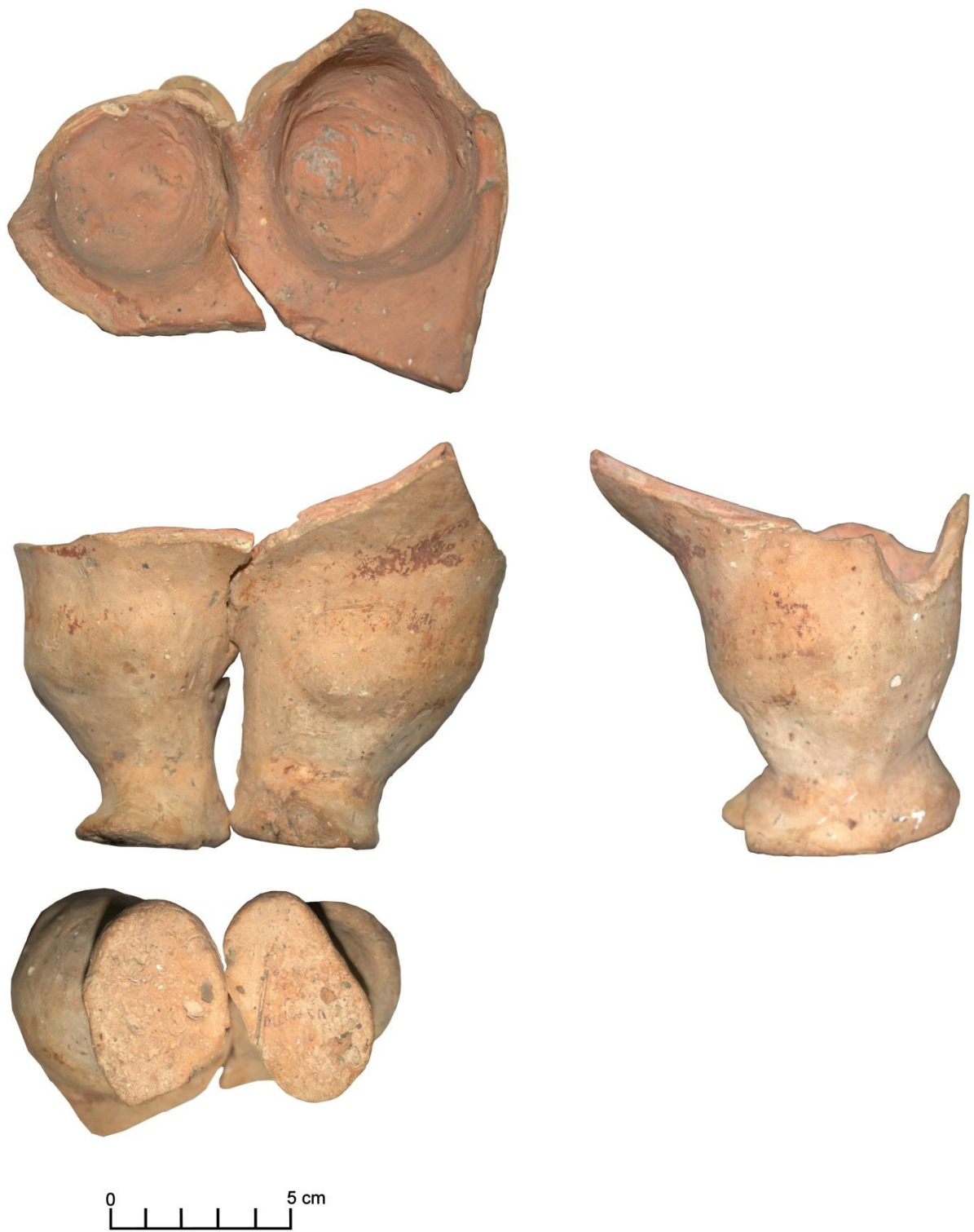
Fig. 1. Vas antropomorf descoperit la Mitoc, Valea lui Stan (neinventariat).