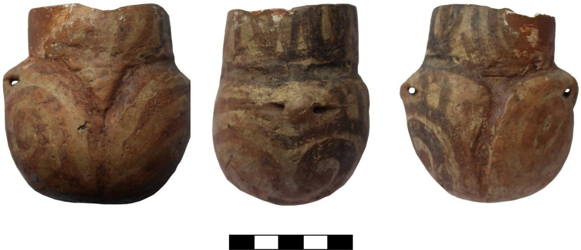
Fig. 7. Vas antropomorf miniatural descoperit la Drăgușeni-Ostrov (Inv. Muzeul de Arheologie din Săveni nr. 324).