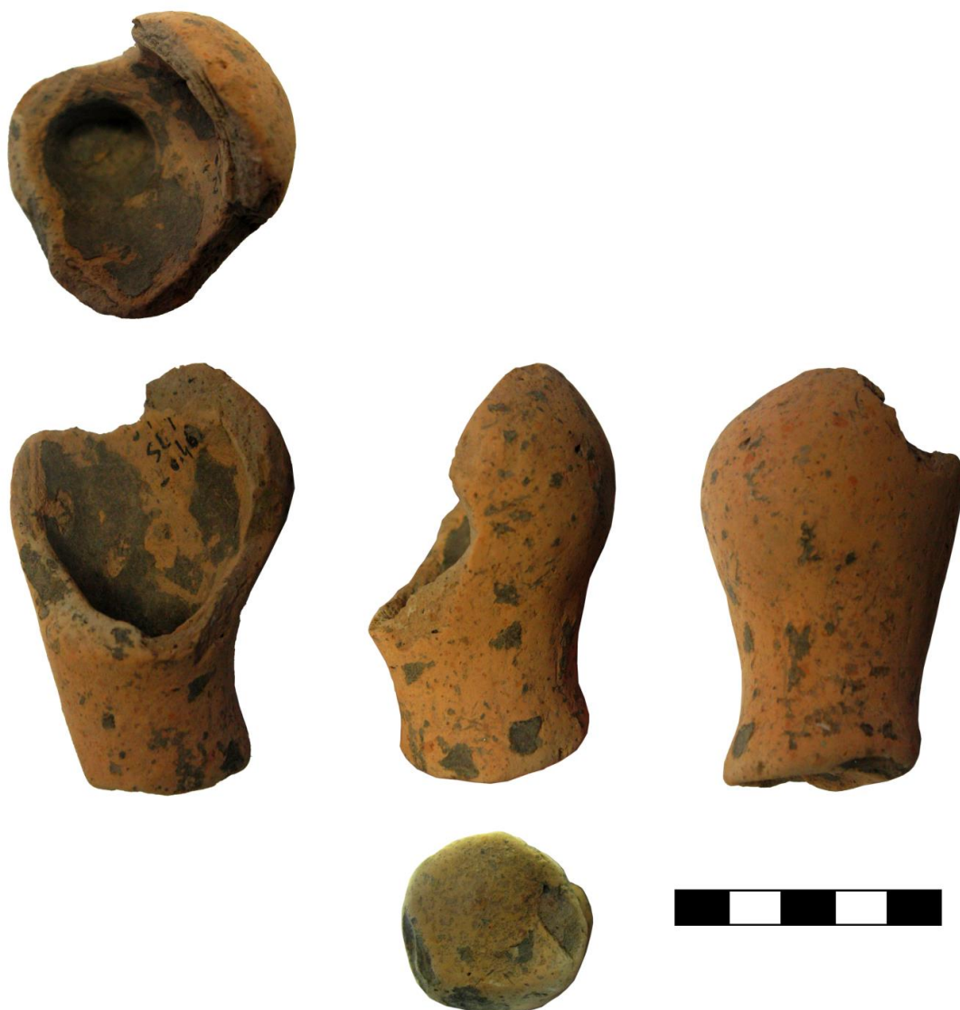
Fig. 11a. Vas antropomorf miniatural descoperit la Ștefănești-La Bulboana lui Stârcea (neinventariat).