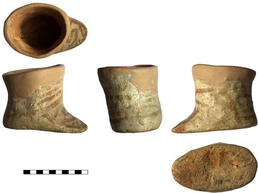
Fig. 8. Vas-picior/vas-cizmulică descoperit la Drăgușeni-Ostrov (Nr. inv. 833).