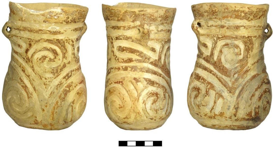
Fig. 6. Vas antropomorf descoperit la Drăgușeni-Ostrov (Nr. inv. 810).