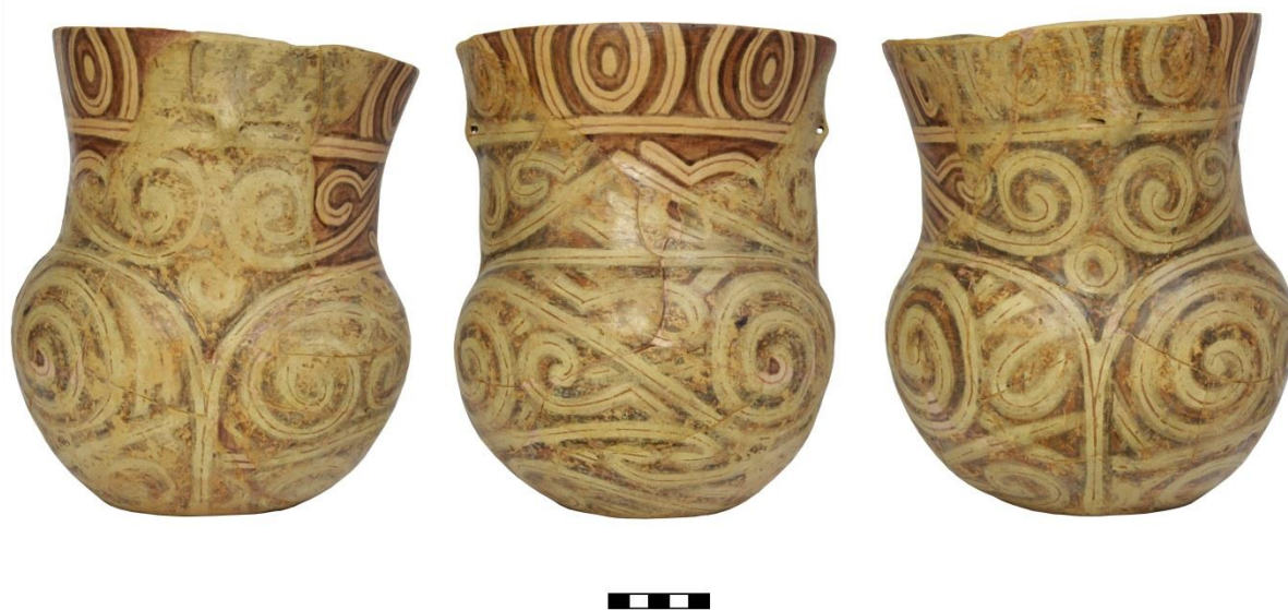
Fig. 3. Vas antropomorf descoperit la Drăgușeni-Ostrov (Nr. inv. 17324).