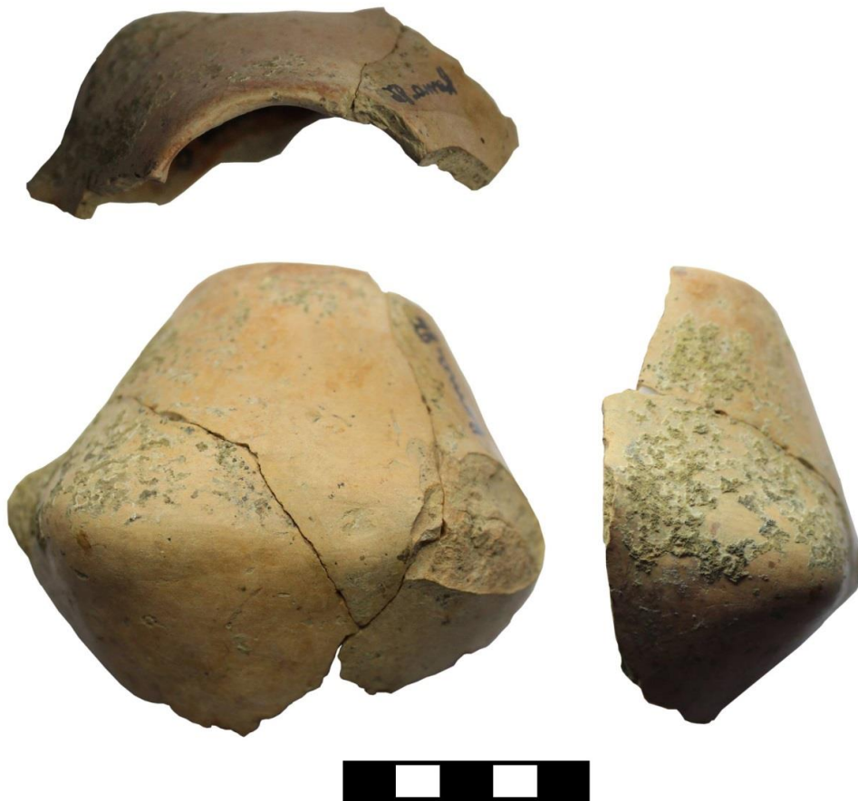
Fig. 10. Vas antropomorf descoperit la Roma-Balta lui Ciobanu (neinventariat).