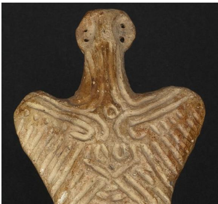
Fig. 14. Medalionul statuetei „Venus de la Drăgușeni”.