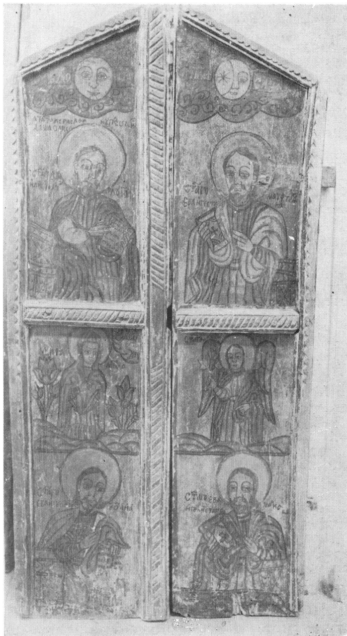
Fig. 1 Ușile împărătești de la Chechiș