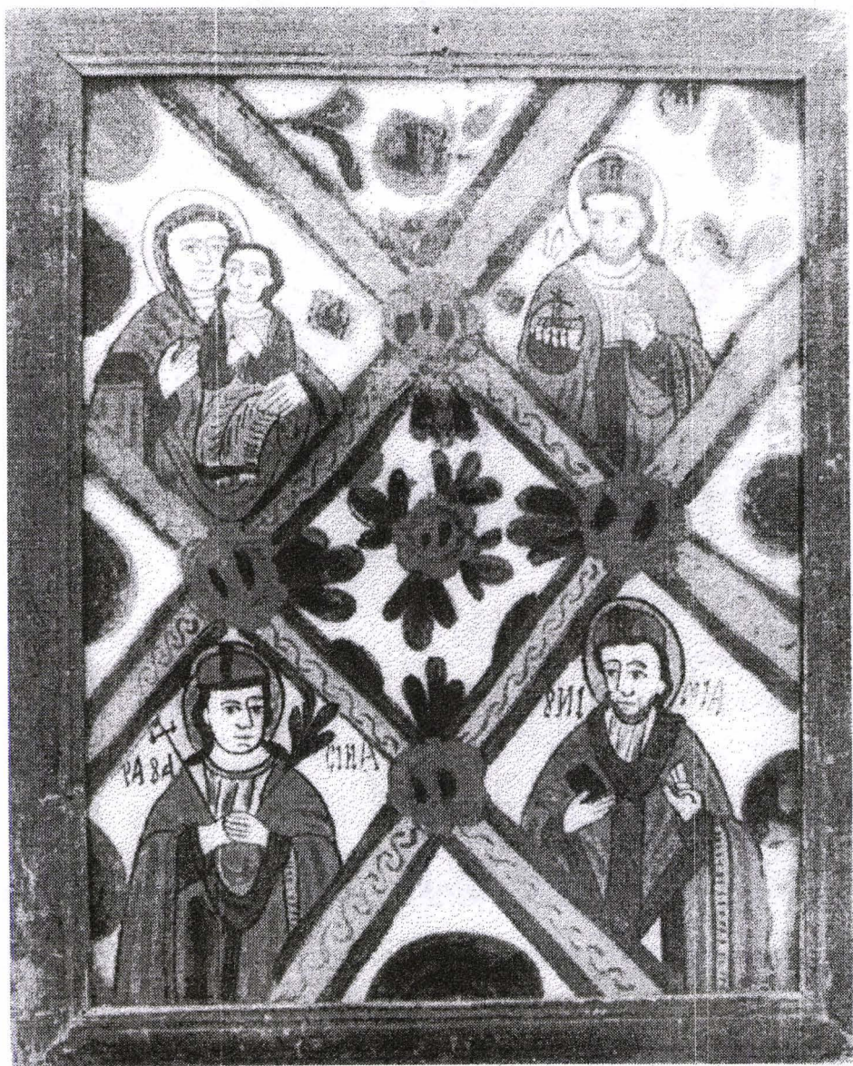
Poza 29. Masa Raiului - a doua jum.șec. XIX - Gherla.