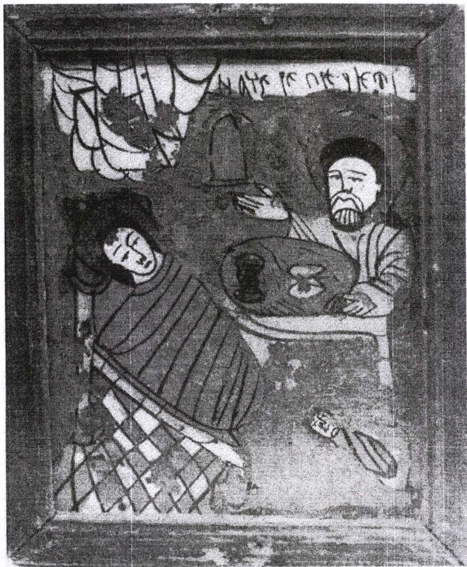
Poza 02. Nașterea Precistei - sf. sec.XVIII -Nicula.