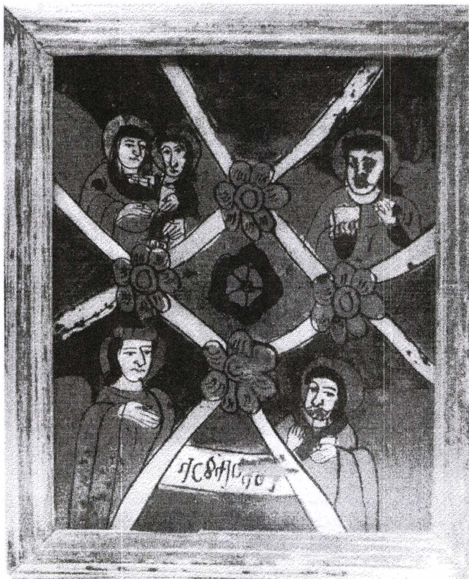
Poza 13. Masa Raiului - cca.1810 - Nicula.