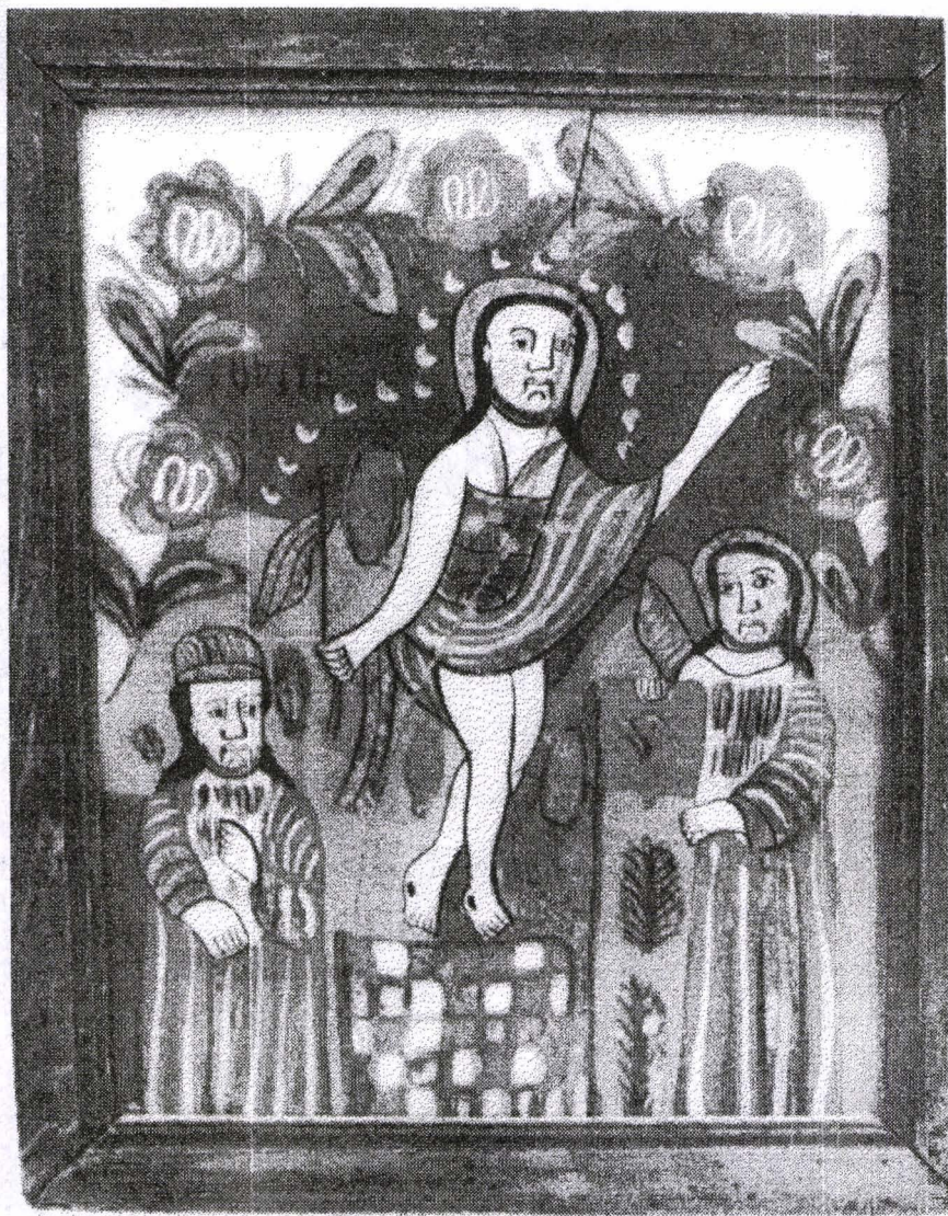
Poza 27. Învierea - sf.sec. XIX - Gherla.