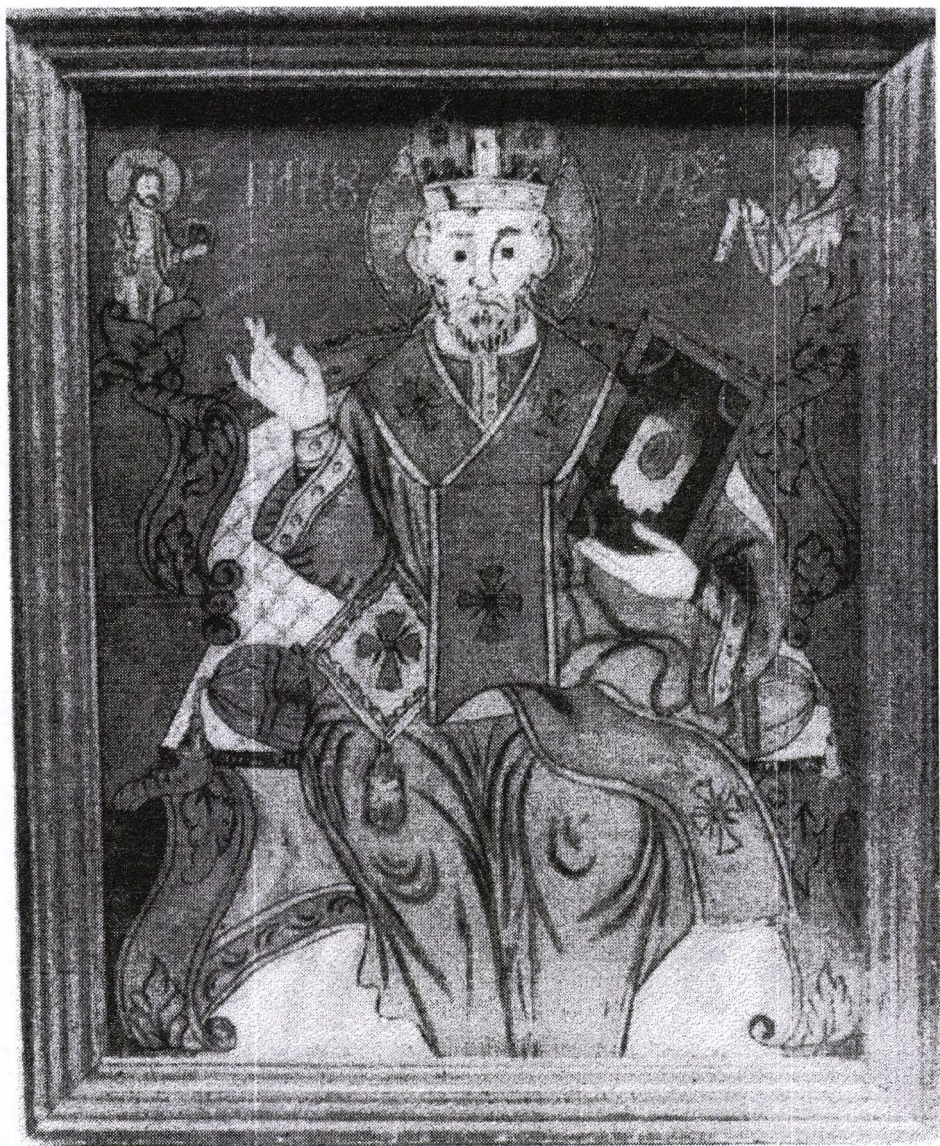
Poza 24. Sf. Nicolaie - cca.1810 - Nord Transilvania.