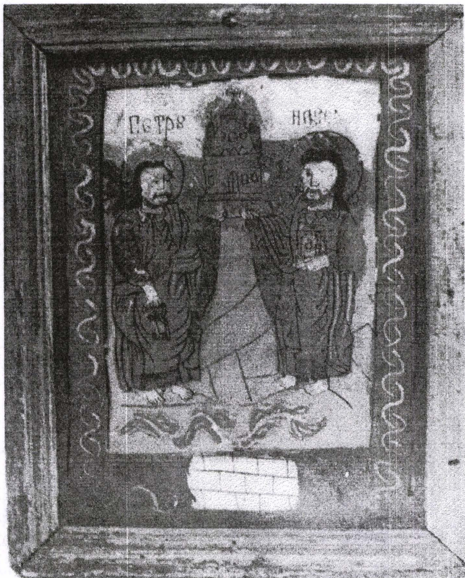
Poza 03. Petru și Pavel - sf. sec.XVIII - înc.sec.XIX - Nicula.