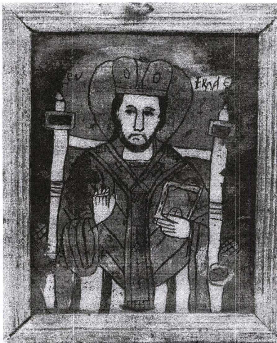
Poza 11. Sf.Nicolae - cca.1830 - Nicula