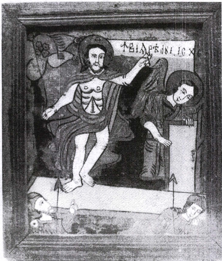
Poza 20. Învierea - cca.1810 - Nord Transilvania.