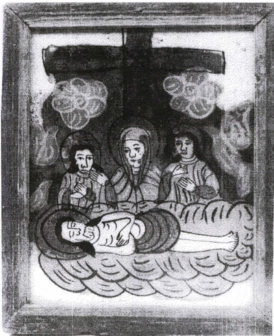
Poza 19. Punerea în mormânt (Plângerea) - mijl. sec. XIX- Nicula.