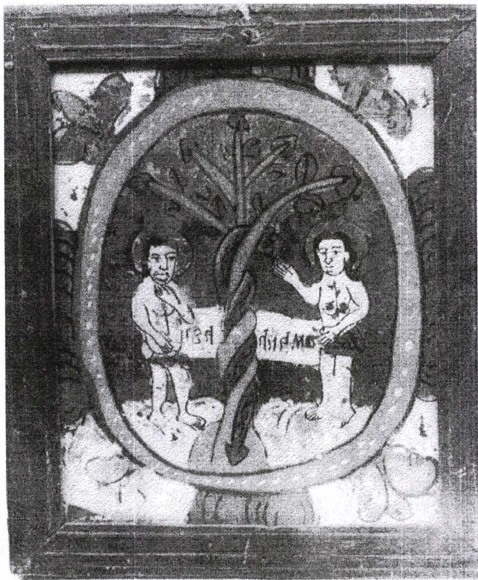
Poza 06. Adam și Eva - înc.sec.XIX - Nicula.