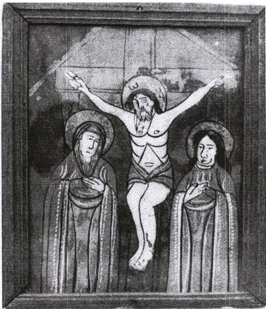
Poza 17. Răstignirea lui Isus- cca.1850 - Nicula.