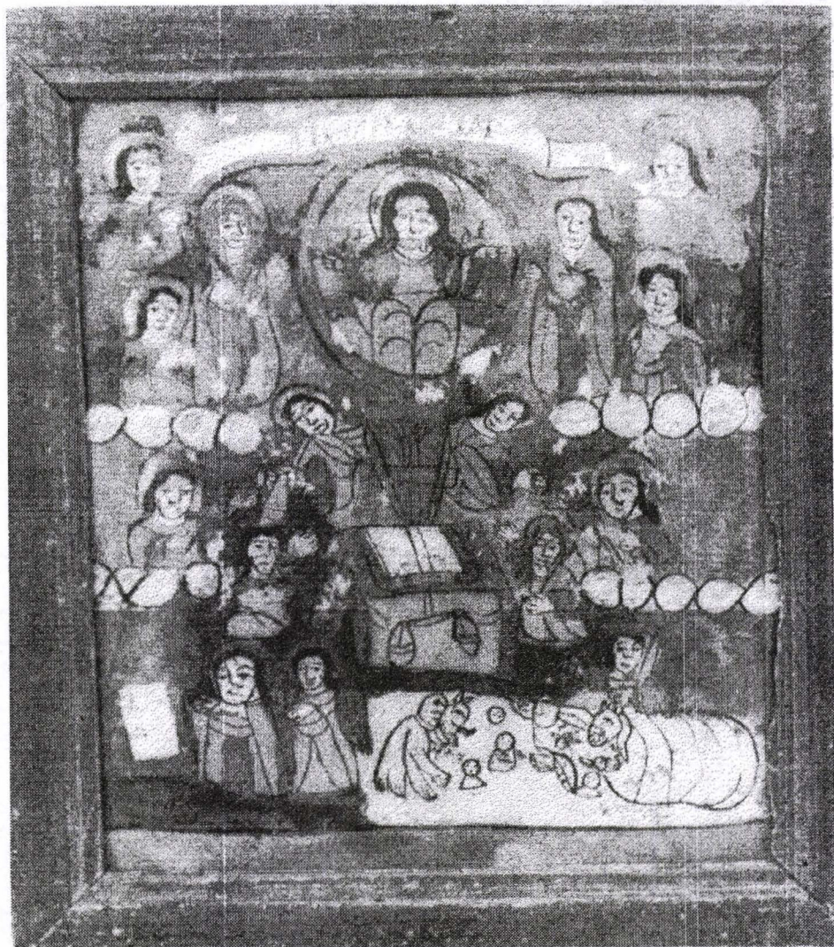
Poza 04. Judecata de Apoi - 1840(?) - Nicula