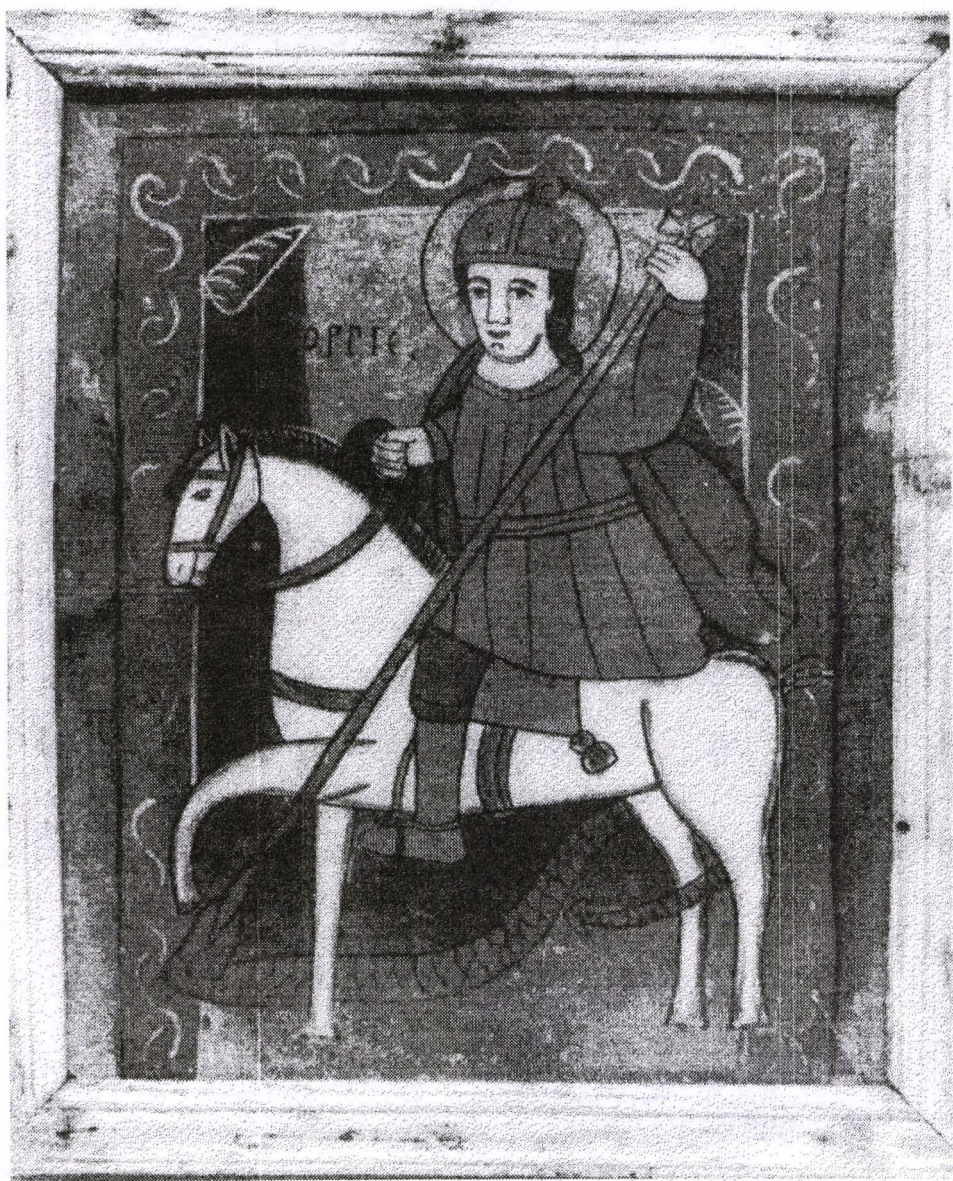
Poza 05. Sf.Gheorghe - sf.sec.XVIII - înc.sec.XIX - Nicula.