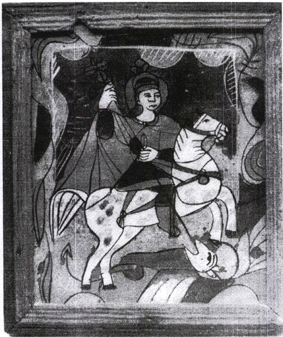
Poza 22. Sf. Gheorghe - mijl. sec. XIX - Nicula.