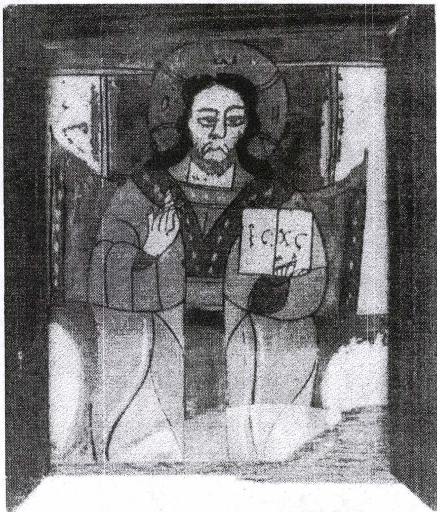
Poza 08. Isus Învățător - sf.sec.XVIII - Nicula.