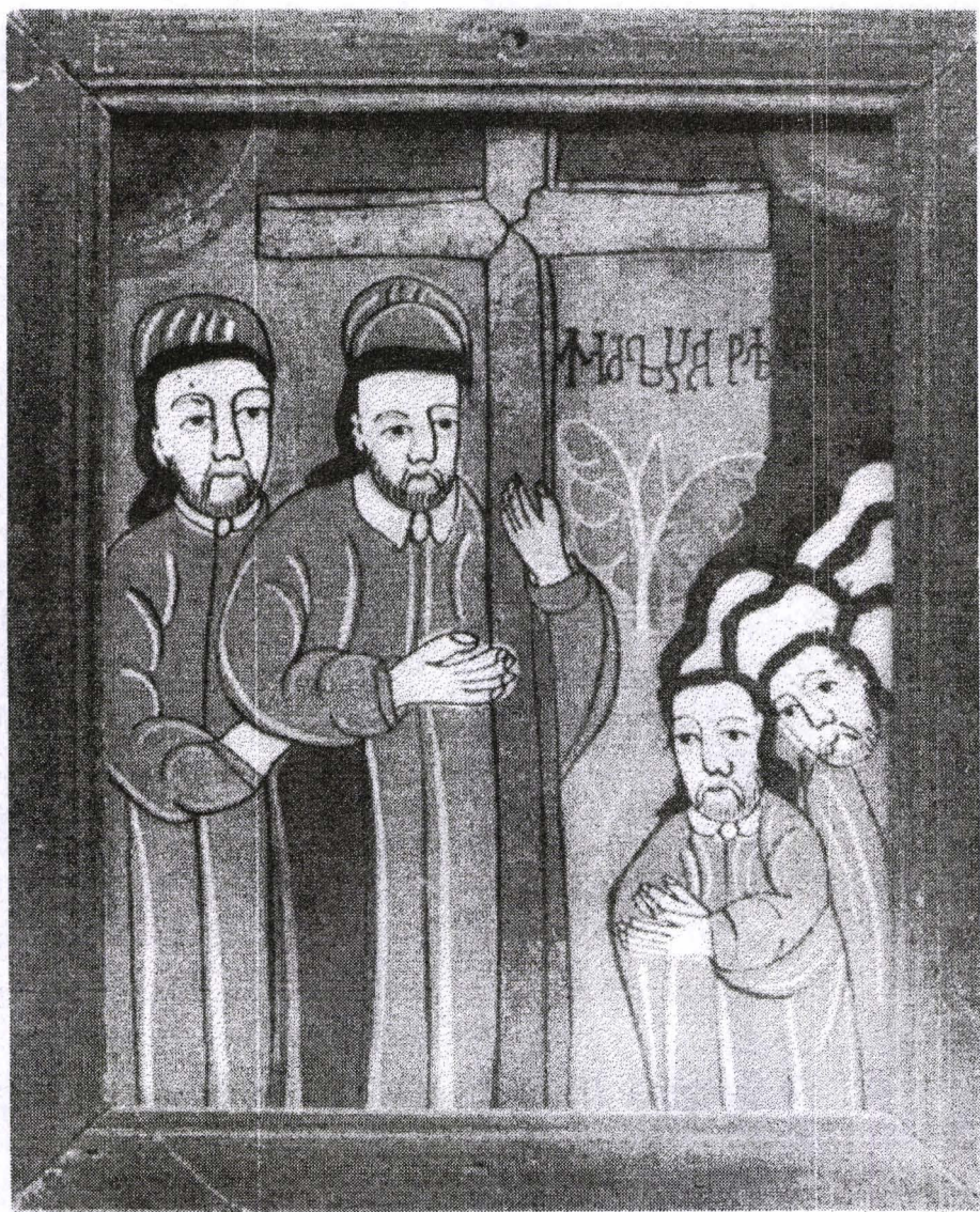
Poza 15. Înălțarea Crucii - cca.1810 - Nicula.