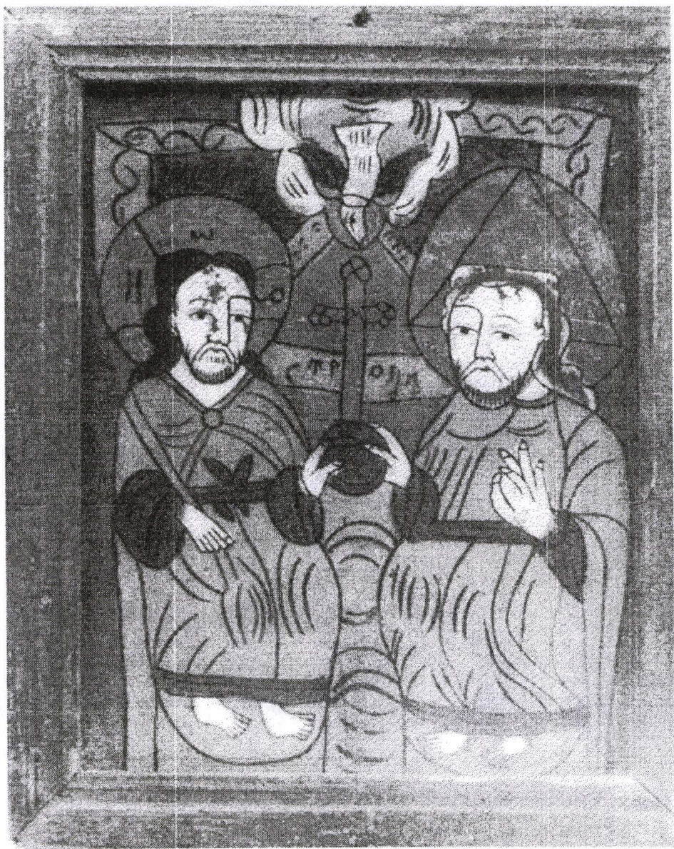
Poza 07. Sfânta Troiță - înc.sec. XIX - Nicula.