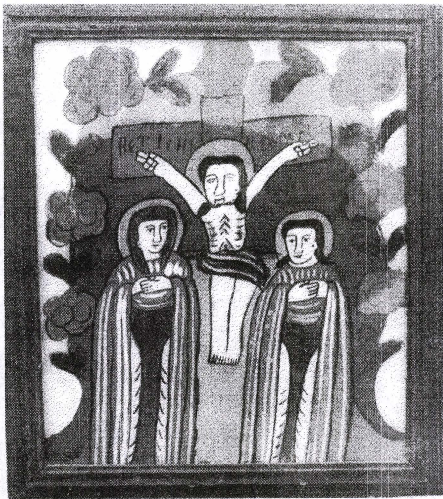
Poza 30. Răstignirea - sf.sec. XIX - Gherla