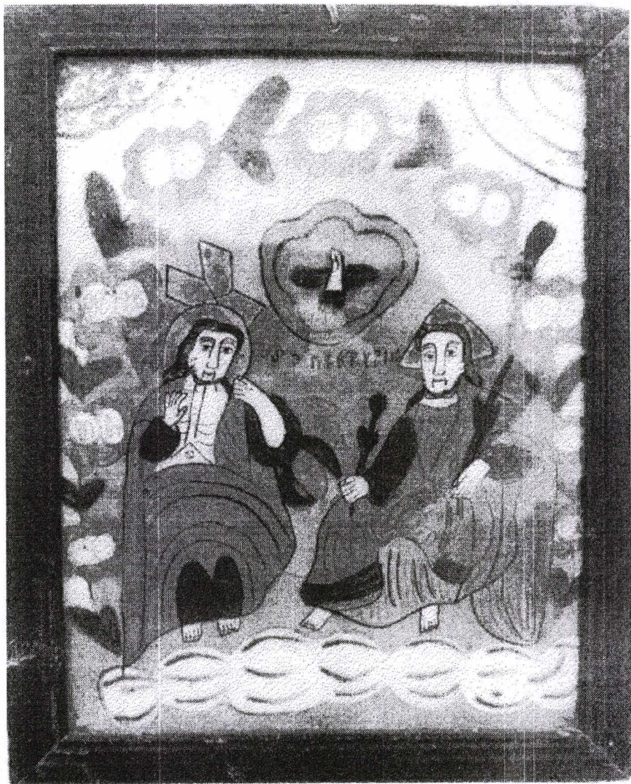
Poza 28. Sf.Treime - a doua jum. sec.XIX - Gherla