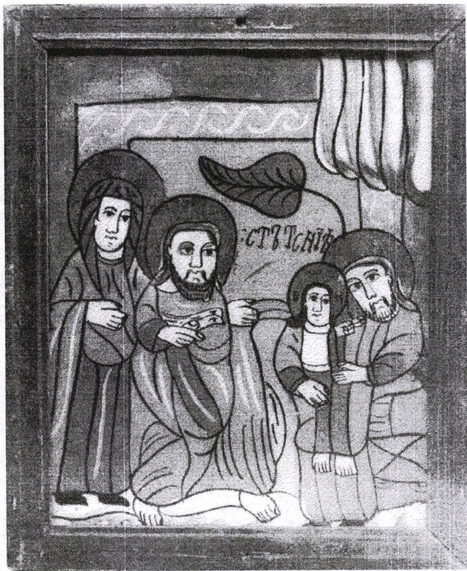
Poza 14. Străenie - Întâmpinarea Domnului - cca.1810 - Nicula.