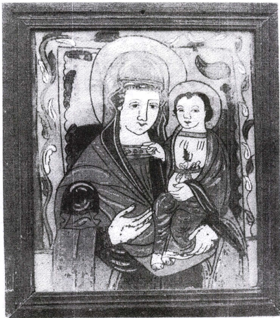
Poza 26. Maica Domnului cu Pruncul - cca. 1830 - Nicula (?)