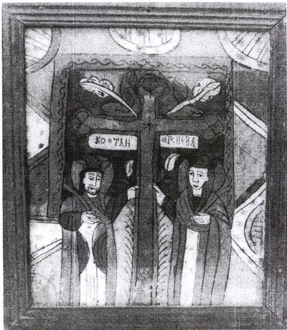
Poza 16. Sf. Constantin și Elena- cca.1830- Nicula