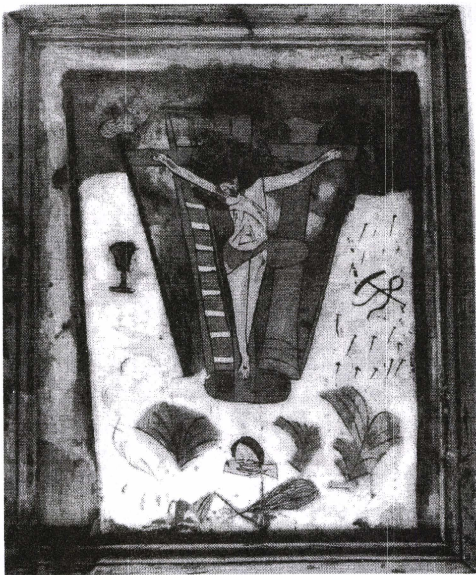
Poza 01. Răstignirea - 1780 (?), Brașov.