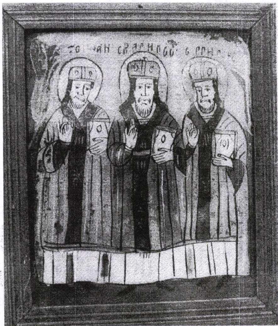
Poza 12. Sf. Trei Ierarhi - mijl. sec. XIX - Nicula.