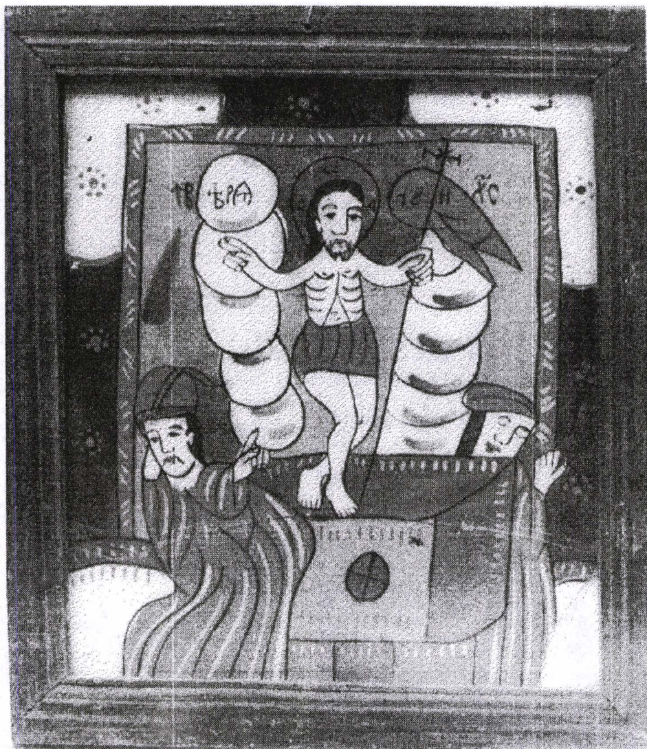
Poza 21. Învierea - mijl.sec.XIX- Nicula.