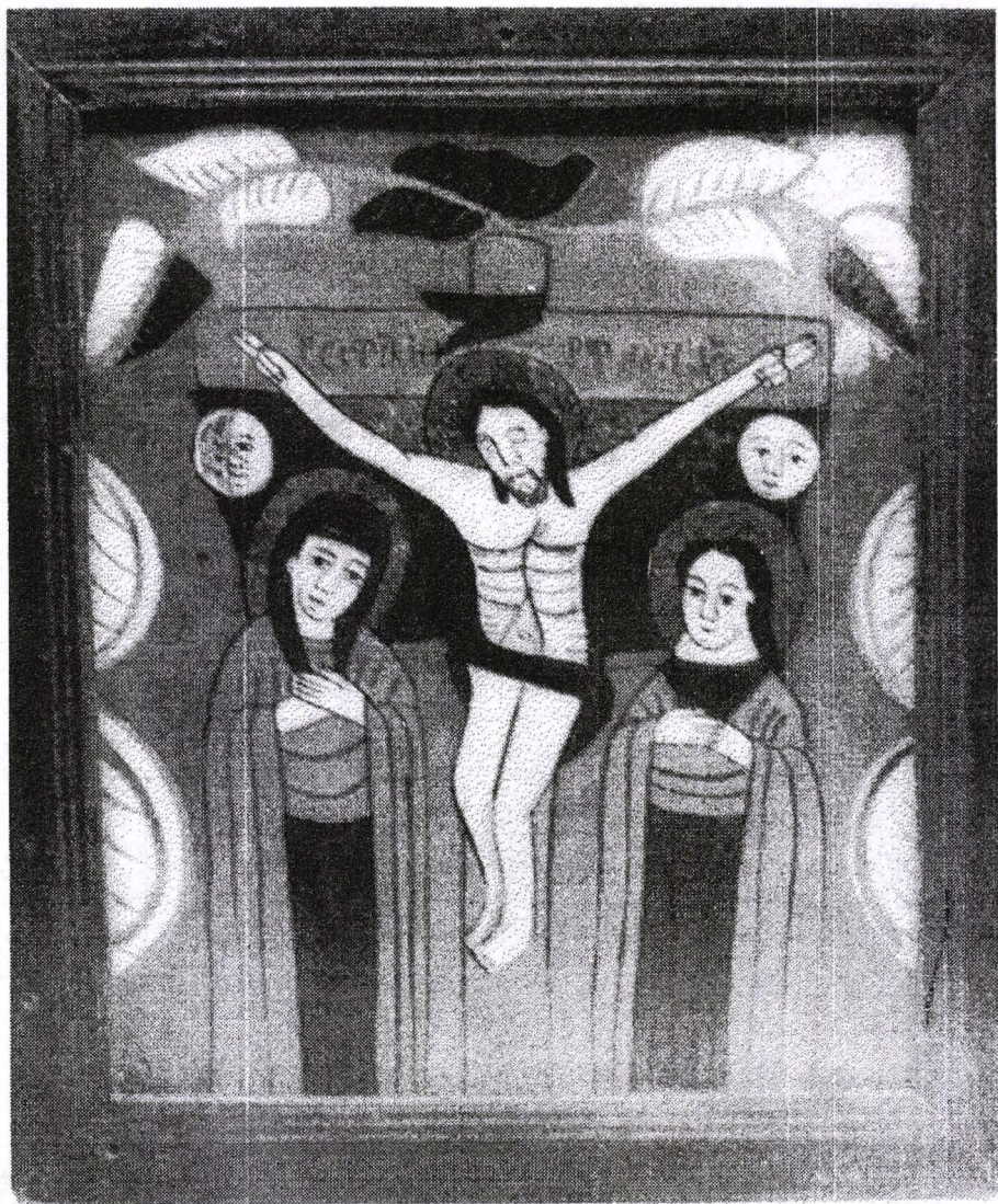
Poza 18. Răstignirea lui Isus - cca.1820 - Nicula.