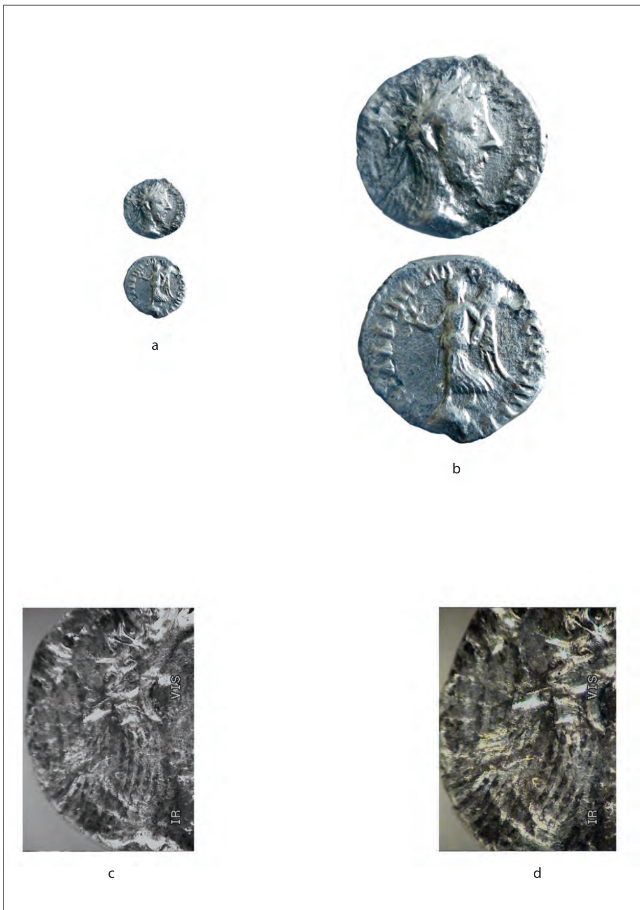
Pl. 1. a. denarius fals/faked Marcus Aurelius (1:1); b. aceeași monedă/same coin 5x; c. fotografie infraroșu cu amprenta/infrared photo of the finger print (S. Alămoreanu); d. detaliu cu amprenta/detail of the fingerprint (S. Alămoreanu).