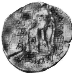
Pl. II. Numărul de pe planșe corespunde cu numărul de ordine din lista monetelor