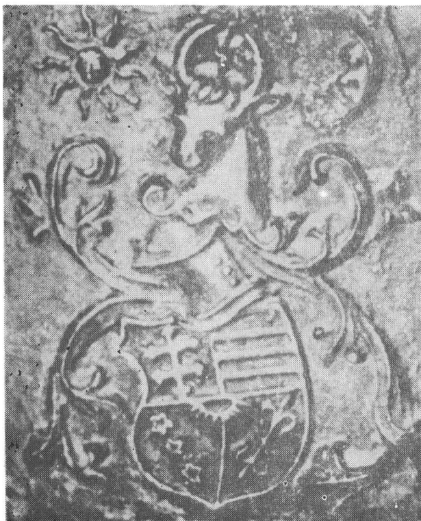
Fig. 4 Stema lui Ștefan cel Mare de pe clopotul dăruit mănăstirii Bistrița