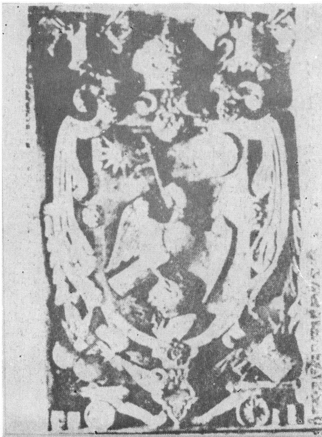
Fig. 2 Stema Țării Românești de pe lespedea funerară a lui Matei Basarab de la minăstirea Arnota