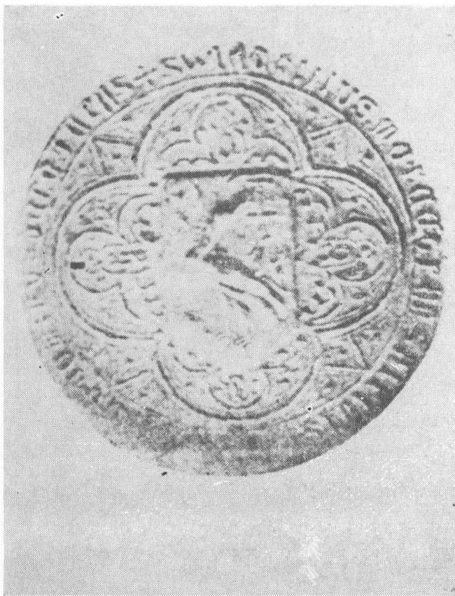
Fig. 1 Pecetea atârnată a lui Dan al II-lea pe privilegiul dat braşovenilor în noiembrie 1425