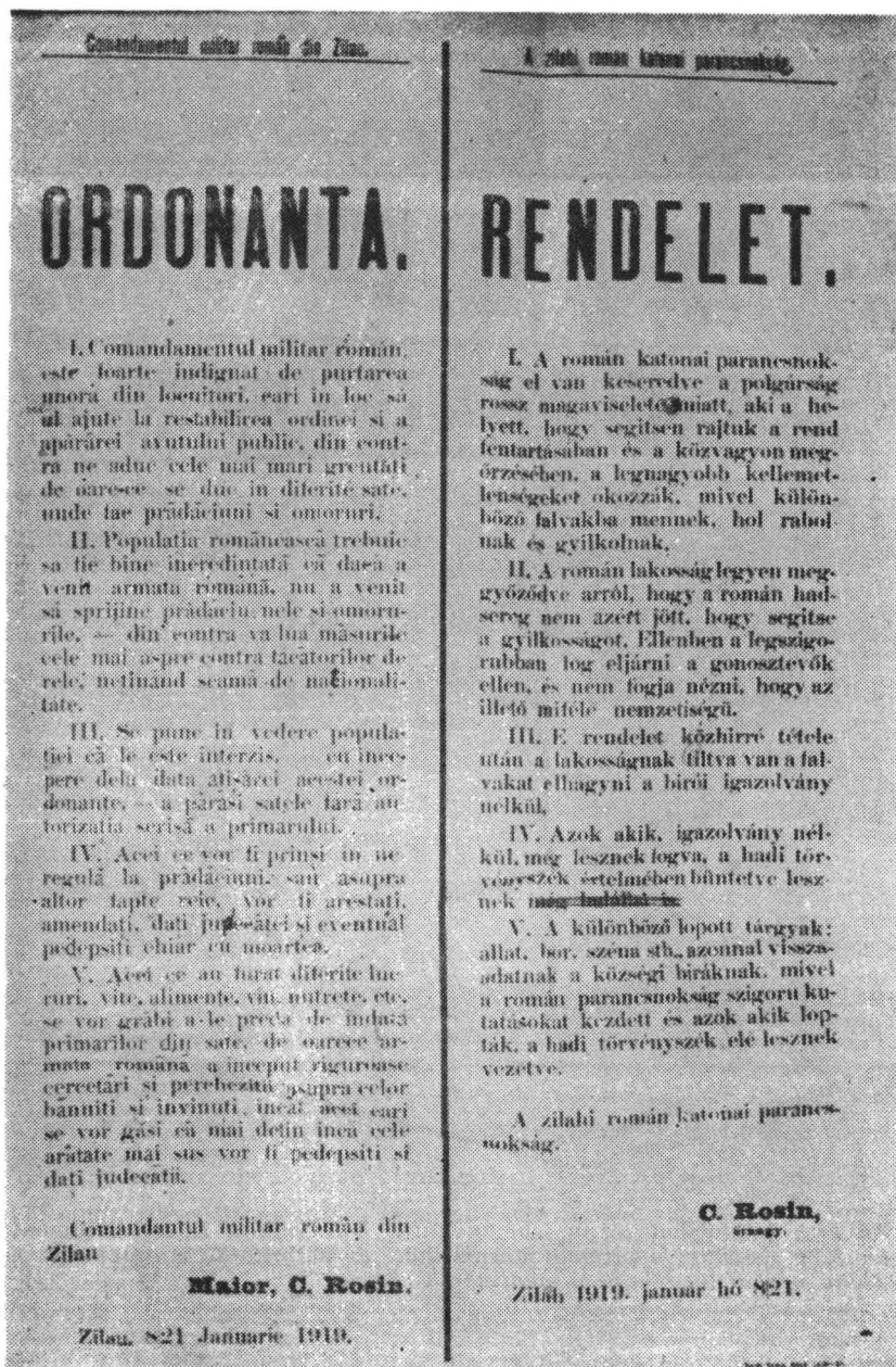
Fig. 3. Ordonanța comandantului militar român al orașului Zalău cuprinzând măsurile luate pentru menținerea ordinii publice în oraș și împrejurimi.