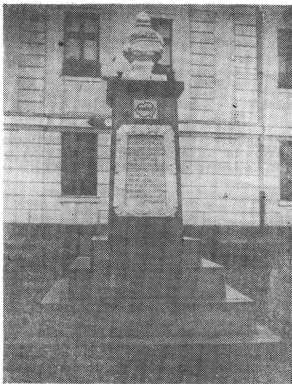
Fig. 1. Fotografia-document a monumentului din Crasna cu textul explicativ și semnătura prim-pretorului Vasile Pășteanu