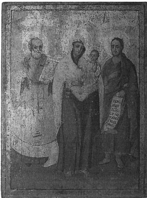
2. Icoană după restaurare