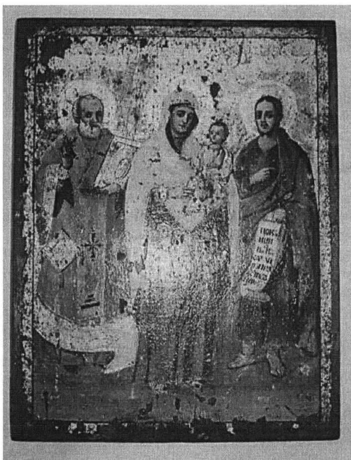
1. Icoană înainte de restaurare

The icon „Mother of God with St. Nicholas and St. John the Baptist” is a transilvanian icon with greeks influences. The painted support is quite well preserved but the painted surface is damaged on 30% and the gold leaf is damaged as well. The icon has an inscription dated in 1825. The icon was restored and the chromatic reconstruction was made in watercolors included the places where the gold leaf was damaged. The back of the icon was cleaned and preserved. The icon was protected with dammar varnish.