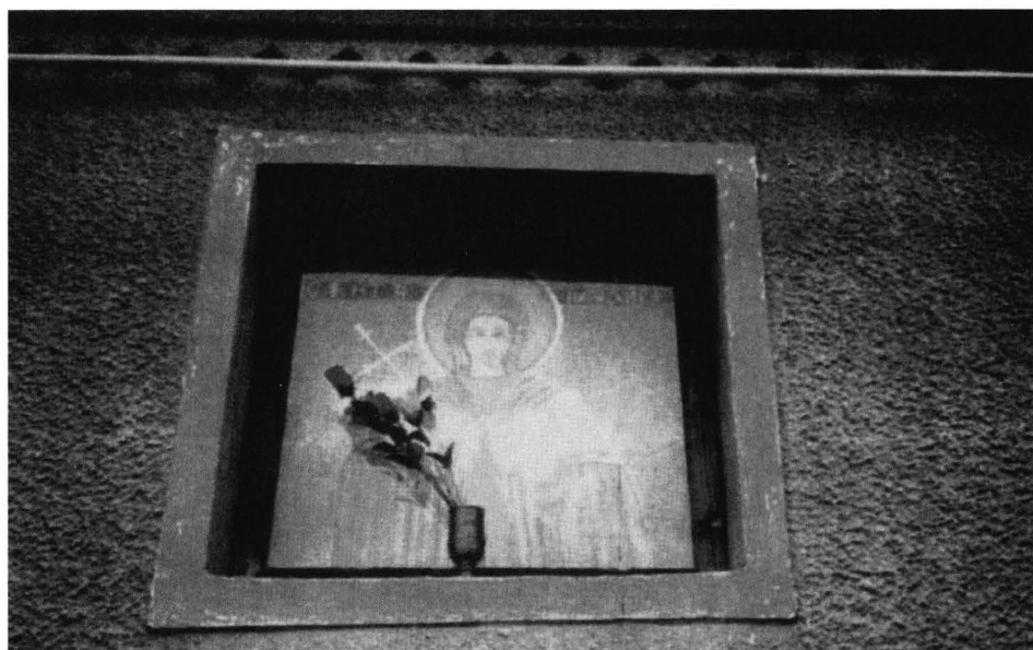
Fig. 4 – Firdă cu hramul bisericii.