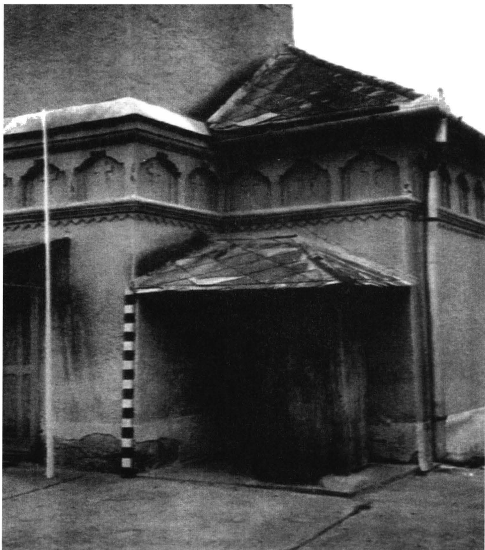
Fig. 5 - Colțul de sud-vest - intrarea în turn