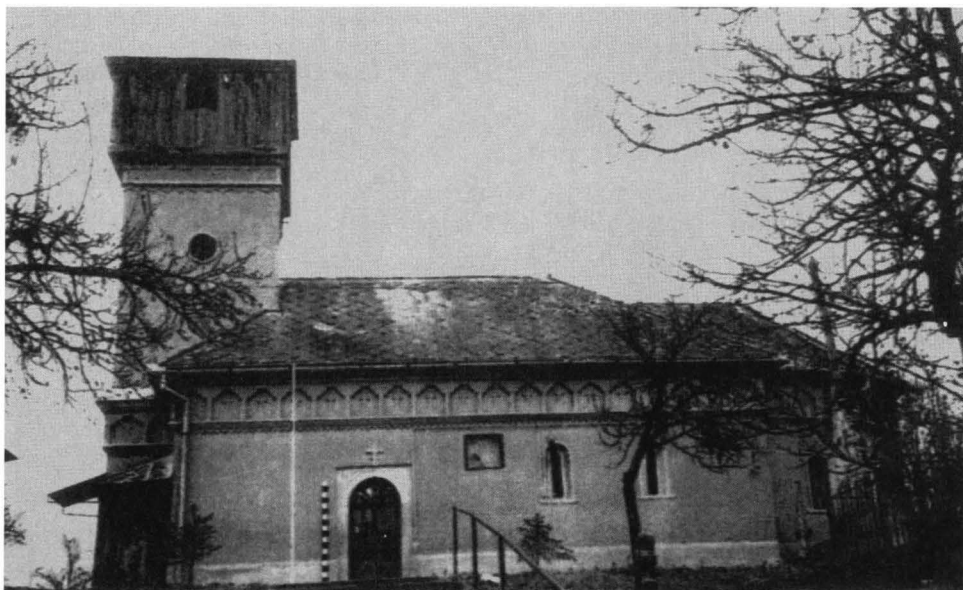
Fig. 2 – Biserica „Cuvioasa Paraschiva” – fațada sudică.