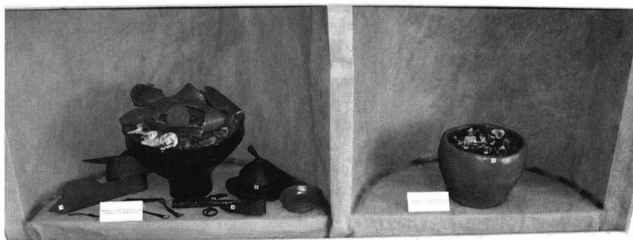
Foto 5. Reconstituirea inventarului mormintelor M6 si M3 (replci).