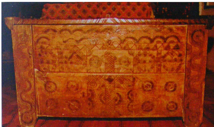
Foto 5. Ladă de zestre încrustată , colecția Muzeului de Etnografie și Artă Populară, Tg. Mureș, înc. sec. XX