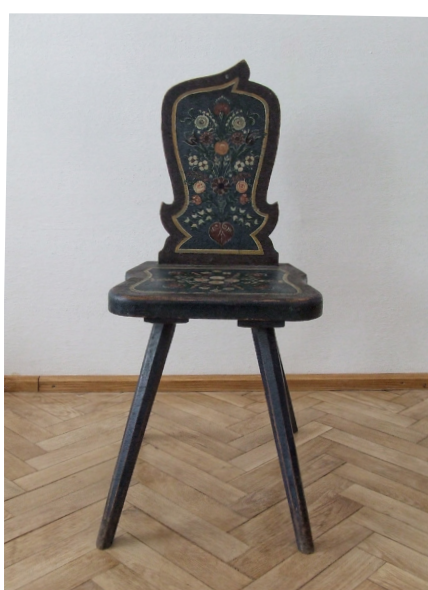
Foto 12 Scaun săsesc, decorat cu motivul garoafei, colecția Muzeului de Etnografie și Artă Populară, Tg. Mureș, înc. sec. XX