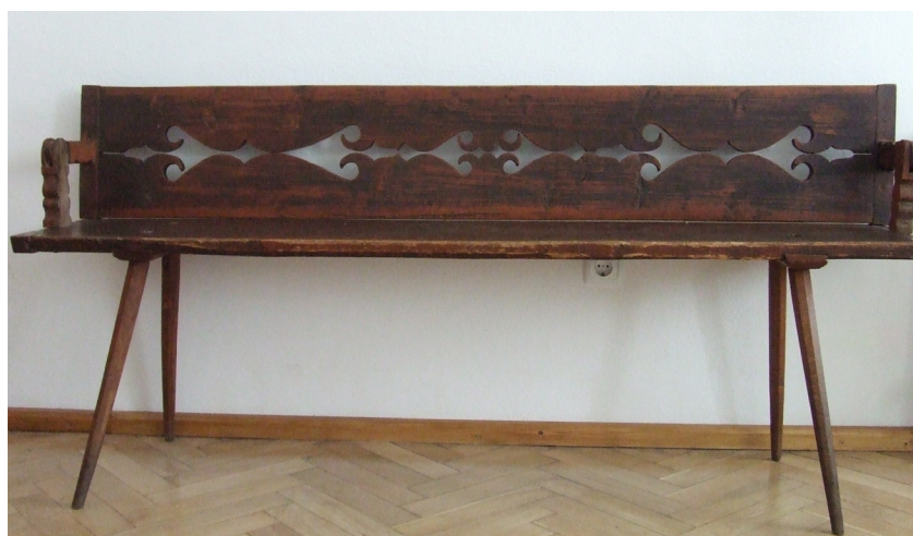
Foto 10. Bancă cu spătar traforat, colecția Muzeului de Etnografie și Artă Populară, Tg. Mureș, înc. sec. XX