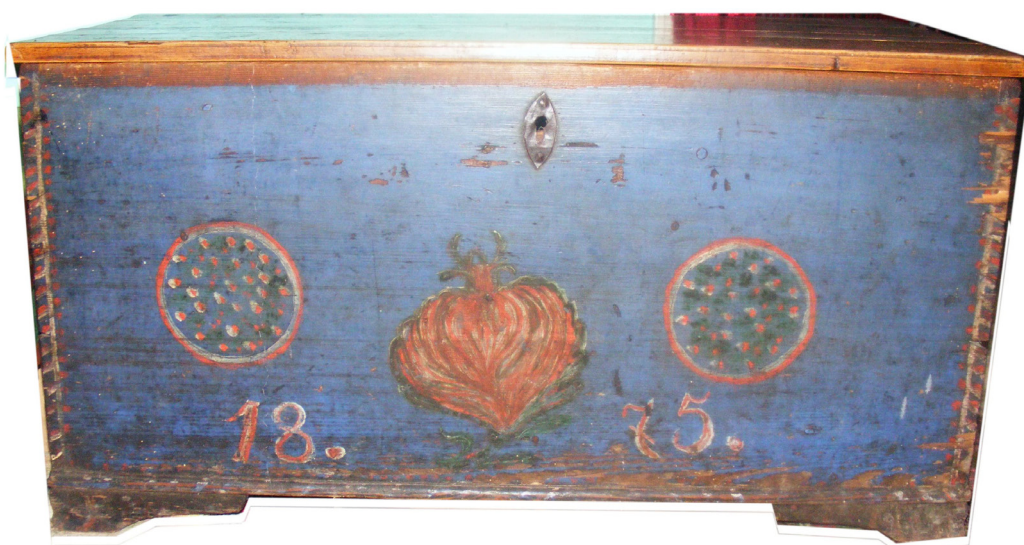
Foto 3. Ladă de zestre pictată , anul construcției 1875, din Bilbor, Mureșul Superior