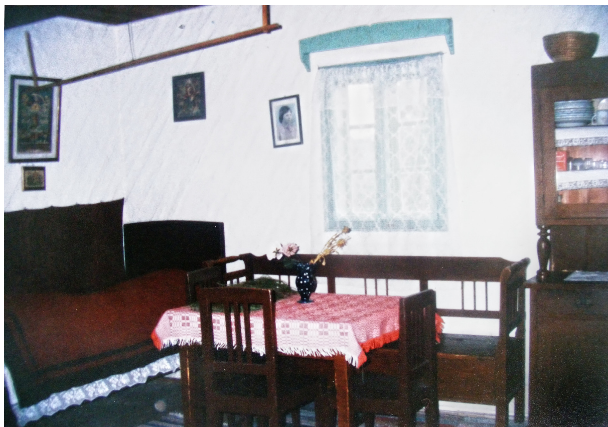
Foto 14. Interior de locuință secuiască din satul Ditrău