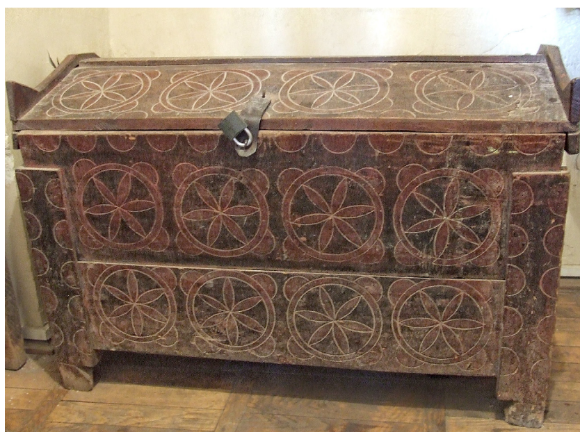
Foto 6. Ladă de zestre încrustată , colecția Muzeului de Etnografie și Artă Populară, Tg. Mureș, înc. sec. XX