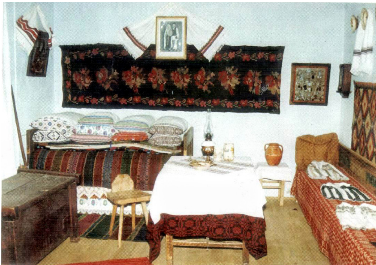
Foto 13. Interior de locuință românească, specific zonei Topliței Mureșului Superior, în expoziția de bază a Muzeului Etnografic Toplița