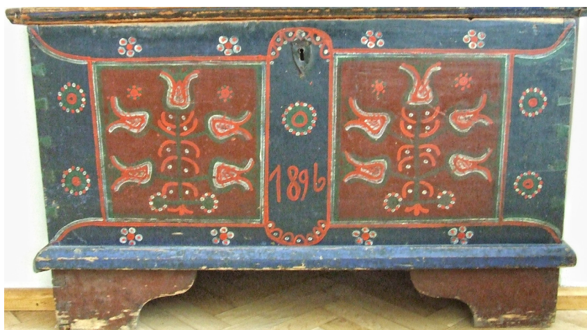
Foto 4. Ladă de zestre secuiască , anul construcției 1896, colecția Muzeului de Etnografie și Artă Populară