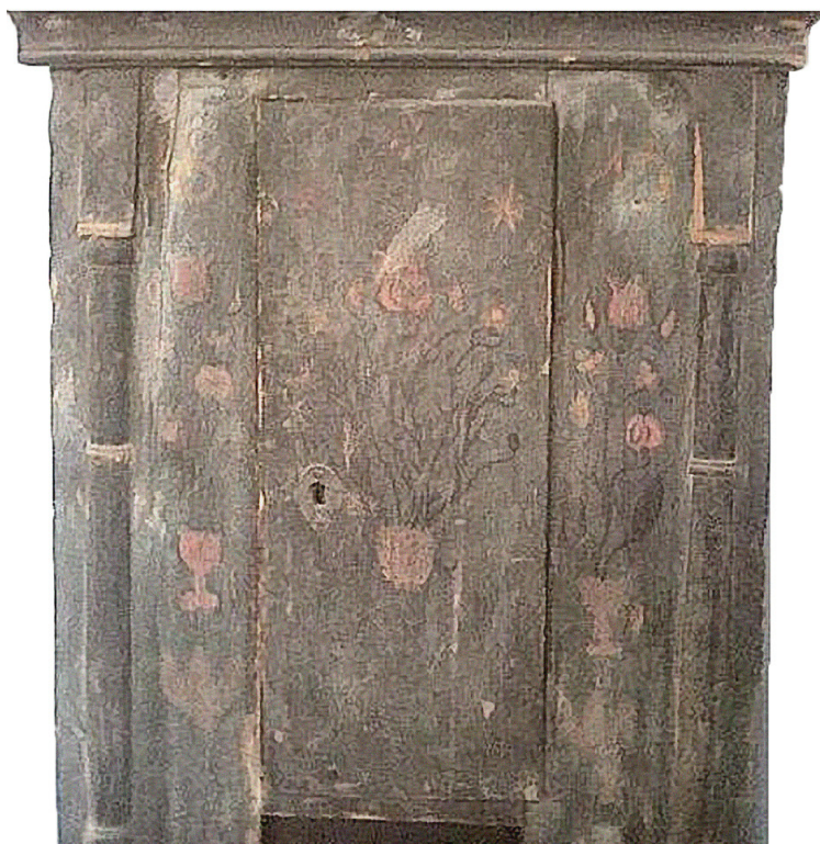
Foto 8 Colțar pictat din Subcetate (1874), în colecția Muzeului de Etnografie Toplița