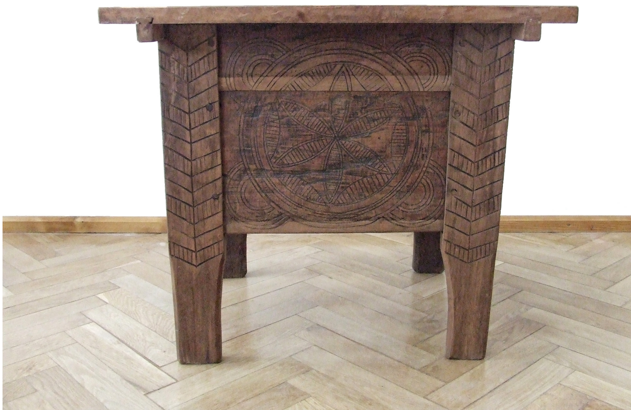
Foto 7. Masă cu ladă, colecția Muzeului de Etnografie și Artă Populară, Tg. Mureș, înc. sec. XX