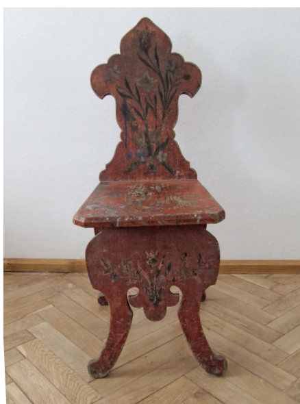
Foto 11. Scaun maghiar, decorat cu motivul lalelei, colecția Muzeului de Etnografie și Artă Populară, Tg. Mureș, înc. sec. XX