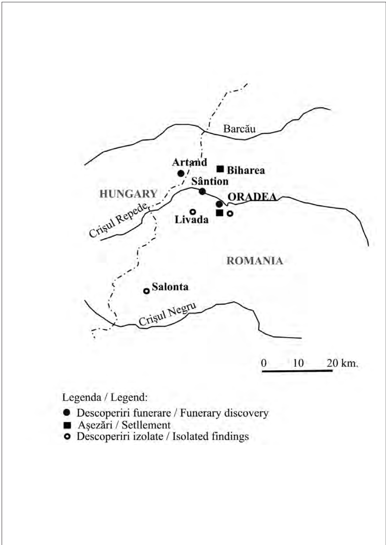
Harta 1. Descoperiri din Hallstattul târziu (Ha D) în jurul orașului Oradea. Map 1. Late Hallstatt (HA D) period discoveries in the neighbouring area from Oradea.