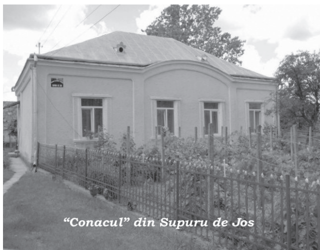
„Conacul” din Supuru de Jos

Revenim puțin la biserica din Supuru de Jos, astăzi folosită de către comunitatea ortodoxă din localitate. Inițial naosul bisericii avea o boltă din cărămidă, înlocuită în anul 1912 cu scânduri 19 . În anul 1912, sub pastorația protopopului Ludovic Rezei s-a făcut o renovare generală a lăcașului; de altfel, în amintirea supuranilor a rămas faptul că protopopul Ludovic Rezei s-a remarcat prin grija pe care a avut-o față de sfântul lăcaș și față de casa care îi găzduia pe parohii-protopopi ai Supurului de Jos. Probabil că au fost necesare și mai mari reparații, înfăptuite în timpul păstoririi părintelui Petru Cupcea, următor într-o slujire la Supuru de Jos și în fruntea protopopiatului lui Ludovic Rezei.