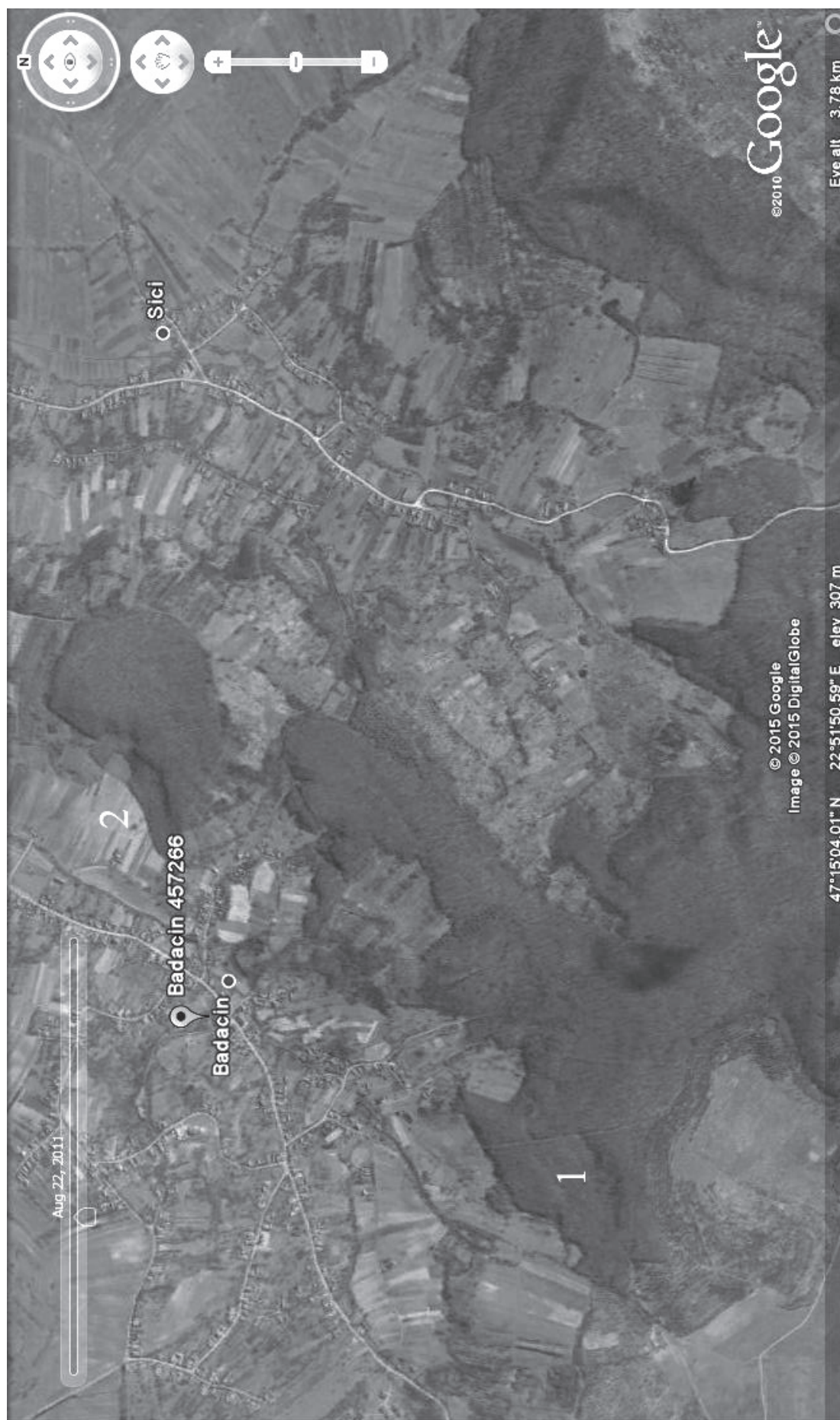
Figura 1. Locul descoperirii pintenului (1) și așezarea de epoca romană de la Bădăcin-Ogrăzi/Vatra Bătrână (2)