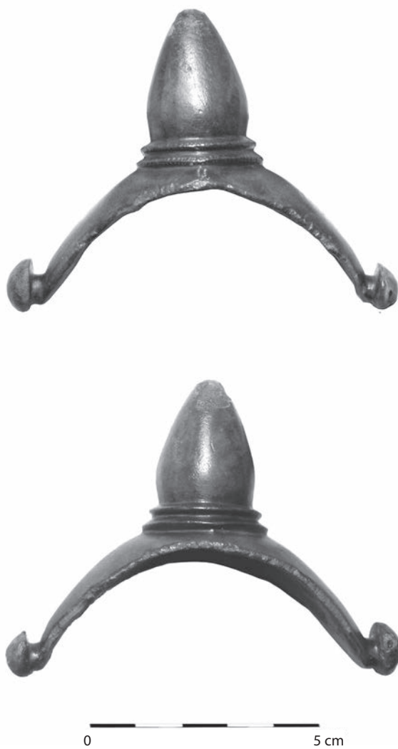
Figura 2. Pintenul din bronz de la Bădăcin (foto) Figure 2. The bronze spur from Bădăcin (photo)