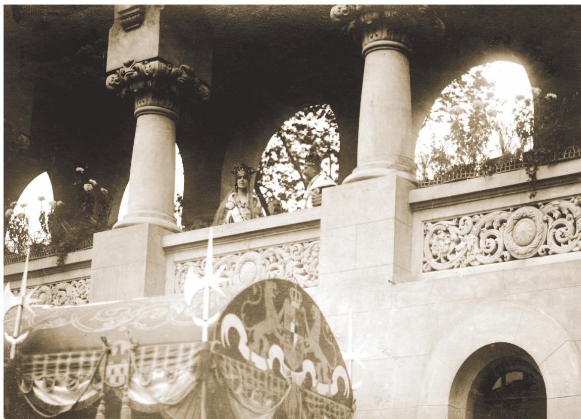
Fig. 16.