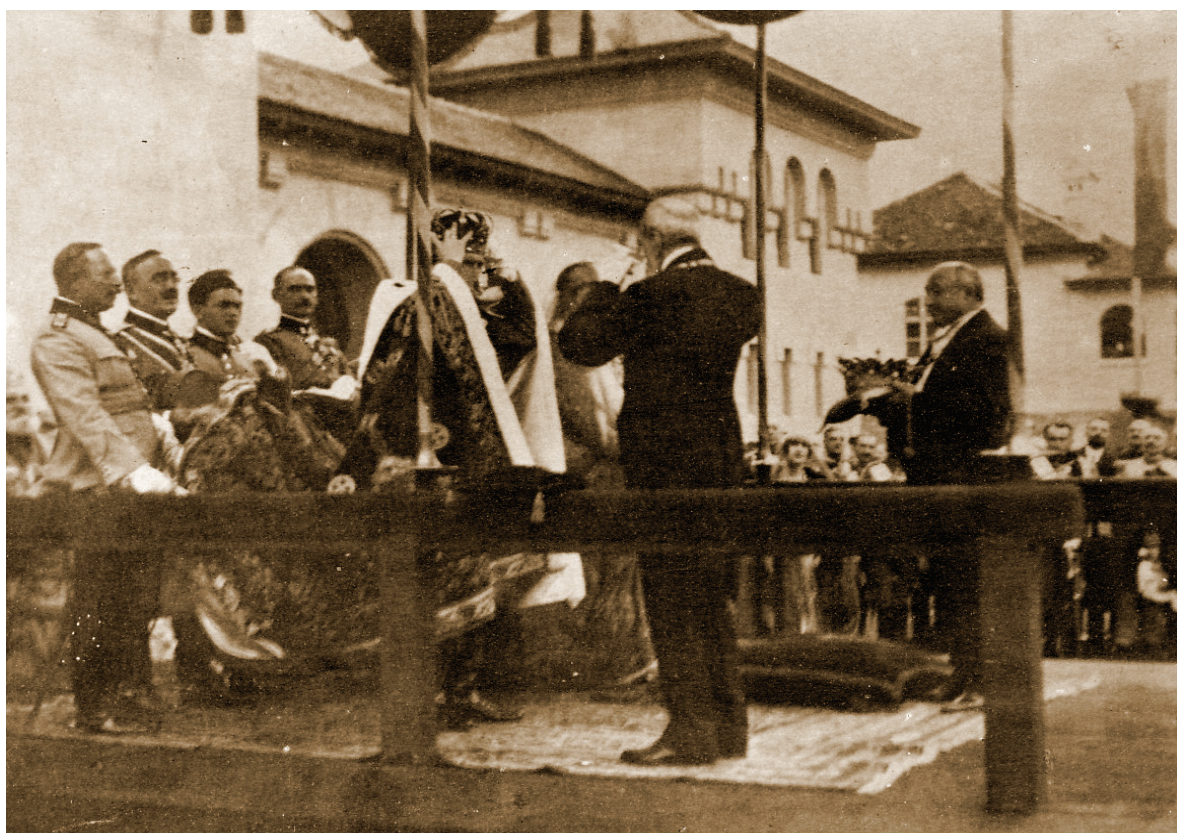
Fig. 14.