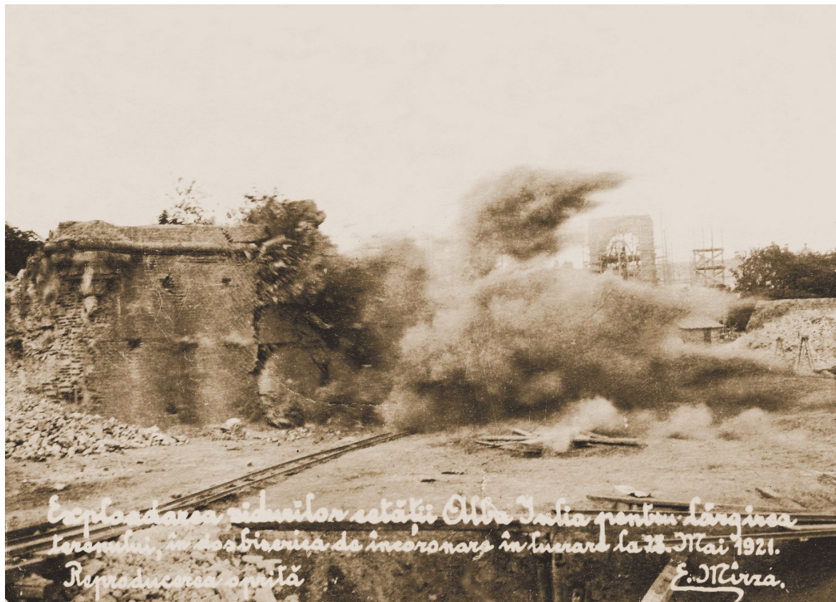
Fig. 1. Colecția Muzeului Național al Unirii Alba Iulia