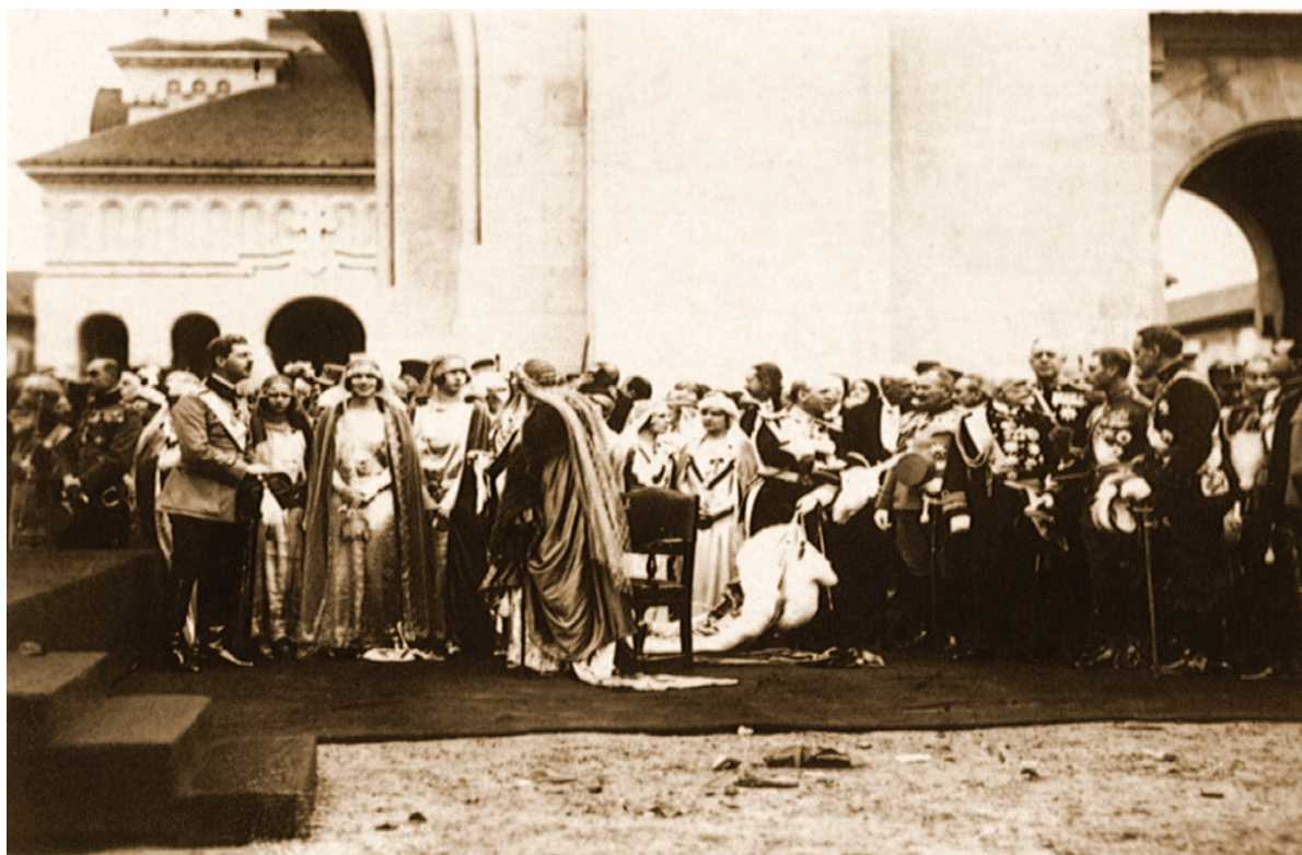
Fig. 13. Colecția Muzeului Național de Istorie a României București