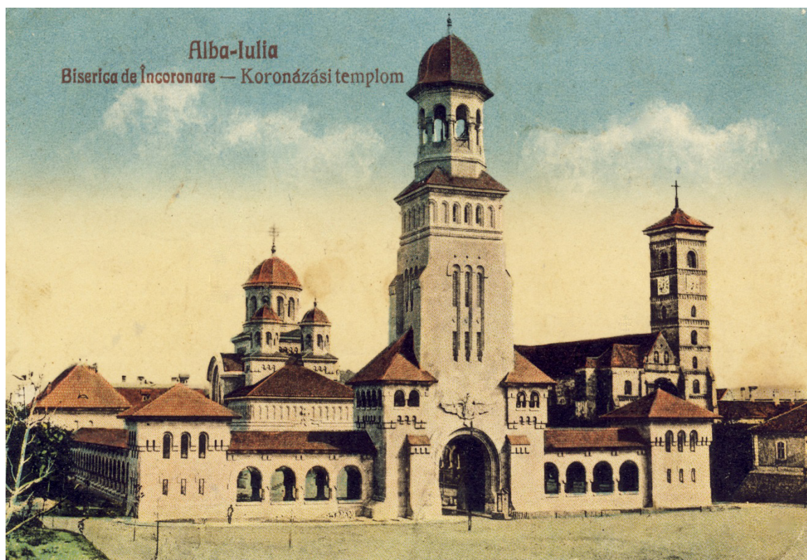
Fig. 7. Catedrala Încoronării.