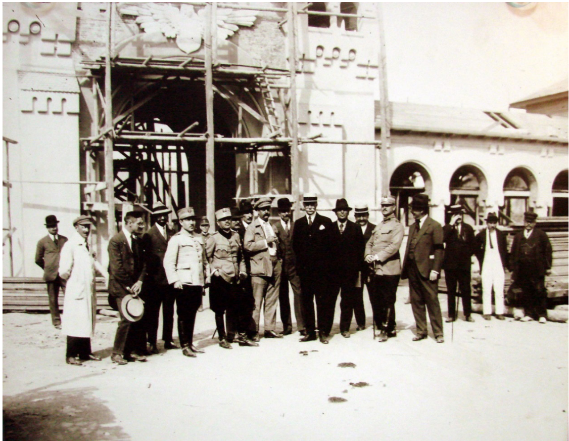
Fig. 5. În fața catedralei.