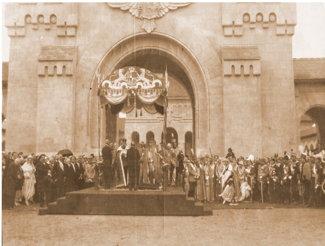
Fig. 15. Colecția Muzeului Național Cotroceni București