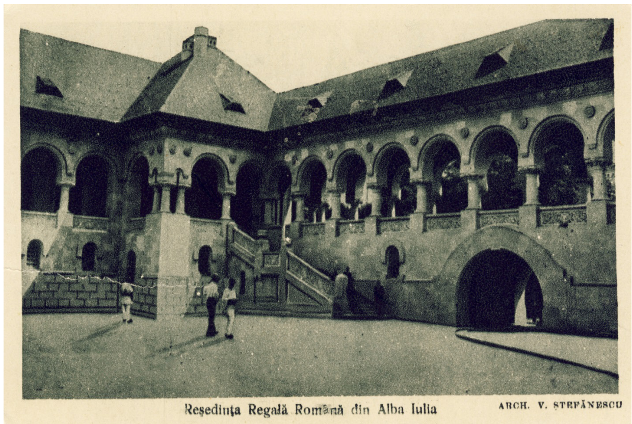
Reședința Regală Română din Alba Iulia