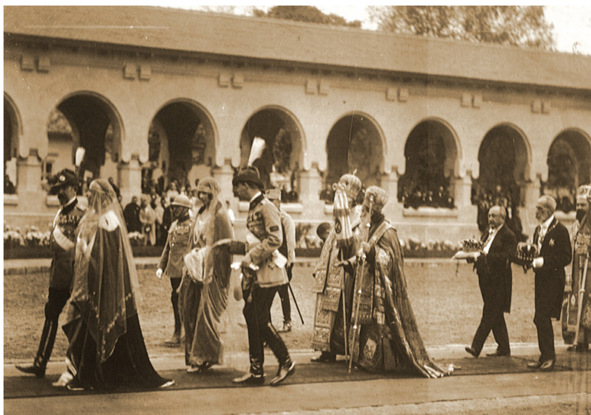
Fig. 12. Colecția Muzeului Național de Istorie a României București