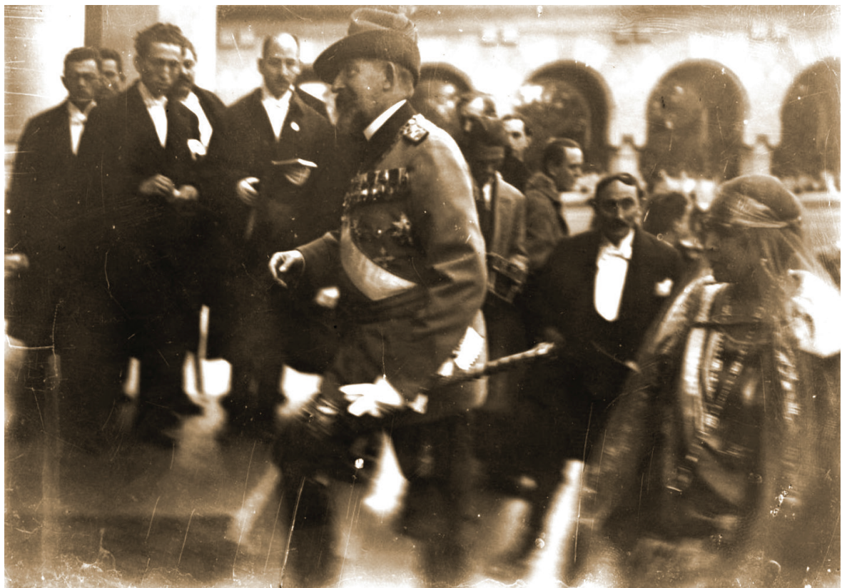
Fig. 10. Pe treptele Bisericii de încoronare.