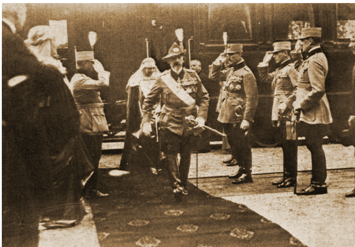
Fig. 8. În gara Alba Iulia. Colecția Muzeului Național de Istorie a României București