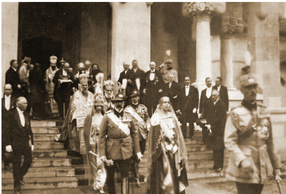
Fig. 11. Pe treptele Bisericii de încoronare.