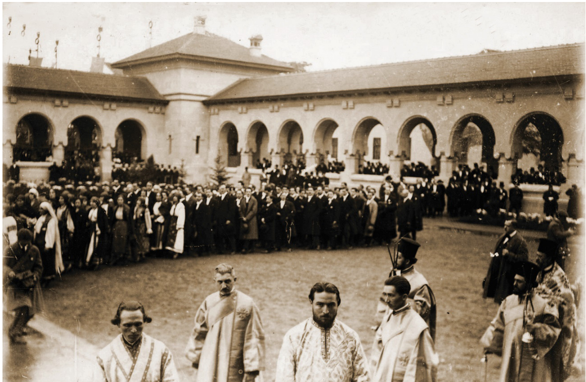
Fig. 9. În așteptarea suveranului. Colecția Muzeului Național de Istorie a României București