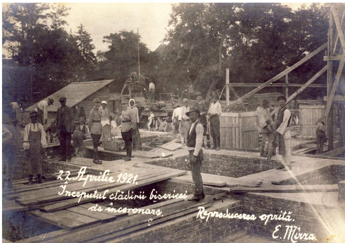
Fig. 2. Colecția Muzeului Național al Unirii Alba Iulia