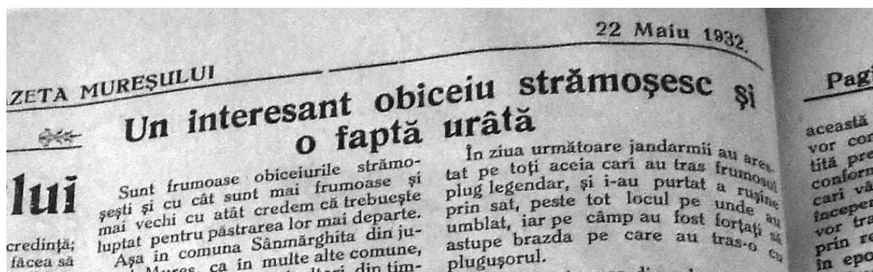
1. Extras din Gazeta Mureșului, 22 mai 1932