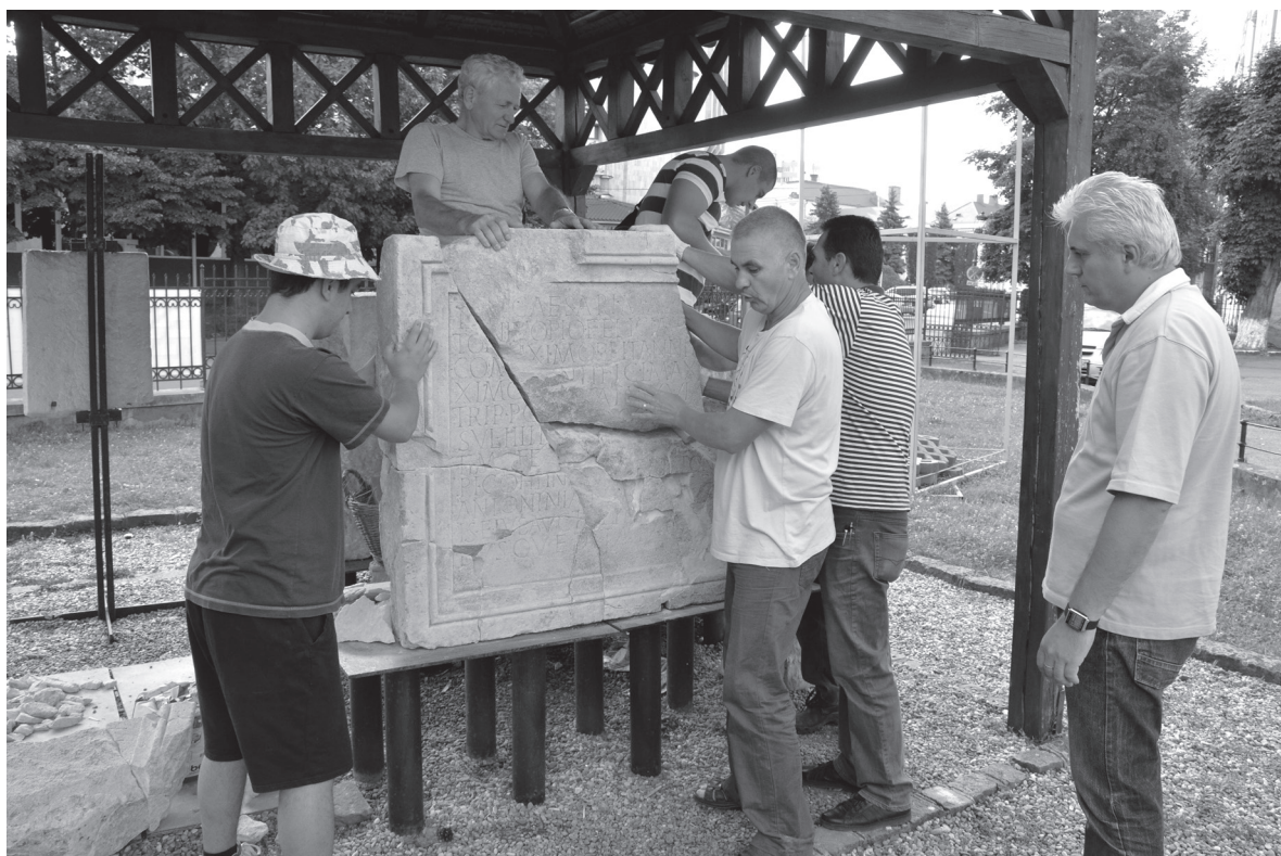
Pl. III. 6. Placa pentru bază de statuie imperială pedestră, în timpul restaurării jumătății superioare.