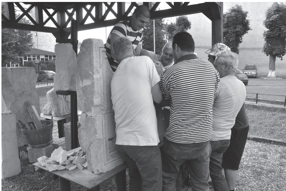
Pl. III. 5. Placa pentru bază de statuie imperială pedestră, în timpul restaurării jumătății superioare.