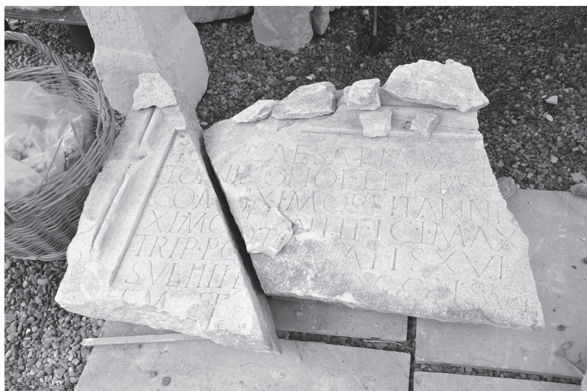
Pl. I. 2. Placa pentru bază de statuie imperială pedestră, după înlăturarea depunerilor humice și a sărurilor.