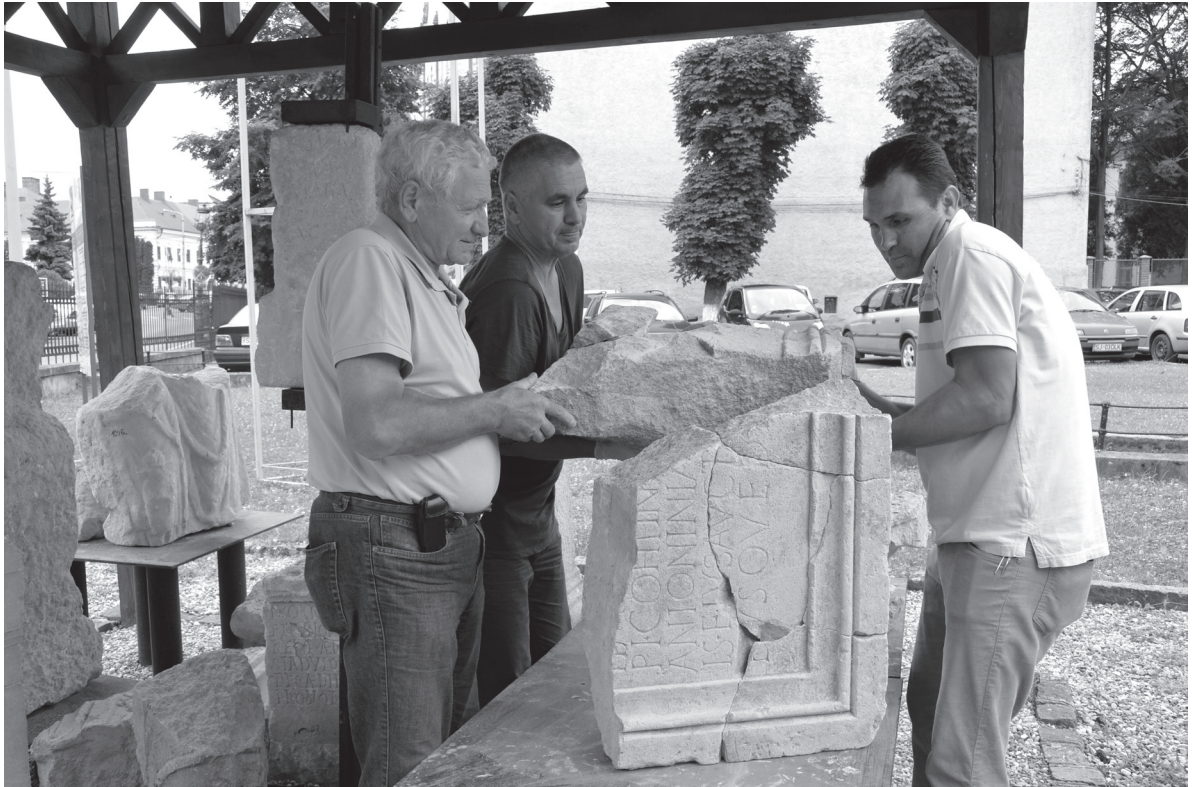
Pl. II. 3. Placa pentru bază de statuie imperială pedestră (jumătatea inferioară), în timpul restaurării.