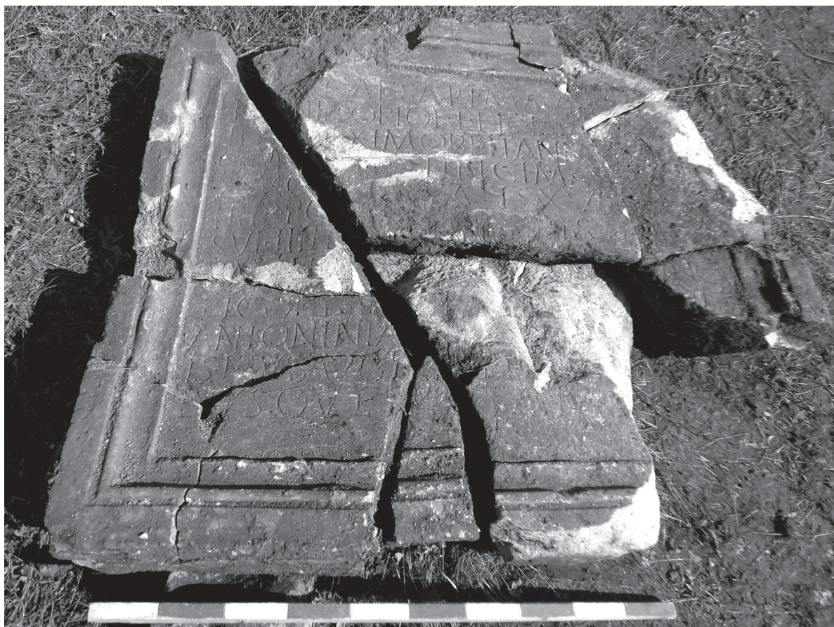
Pl. I. 1. Placa pentru bază de statuie imperială pedestră, înainte de restaurare.