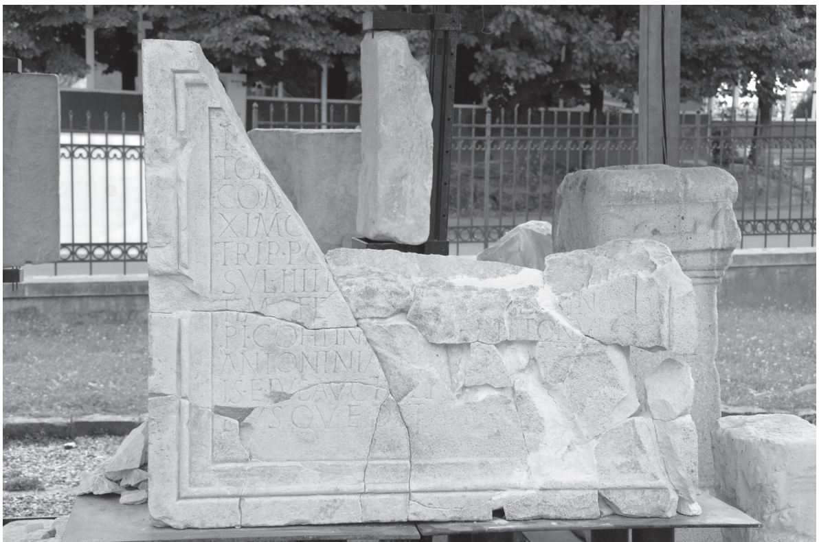
Pl. II. 4. Placa pentru bază de statuie imperială pedestră, după restaurarea jumătății inferioare.