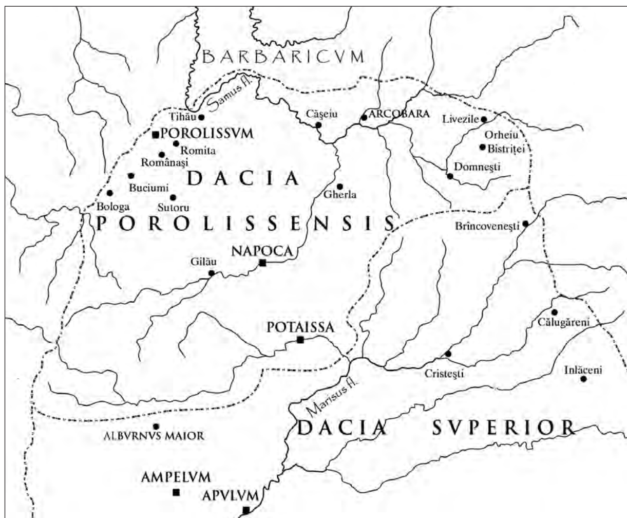
Fig. 1. Carte de la Dacie Porolissensis (D. Dana).

Situé à environ 5 km de Porolissum , sur une terrasse haute de la rivière Agrij, le camp auxiliaire de Romita a été occupé, d'après les inscriptions et en particulier les estampilles téglaires, par des contingents de la cohors II Britannica miliaria (75 estampilles) 9 et de la cohors VI Thracum equitata (une trentaine d'estampilles) 10 .