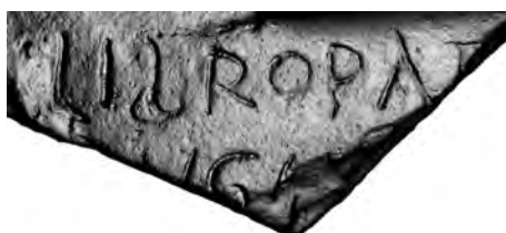
Fig. 3. Détail du tesson - RTI.