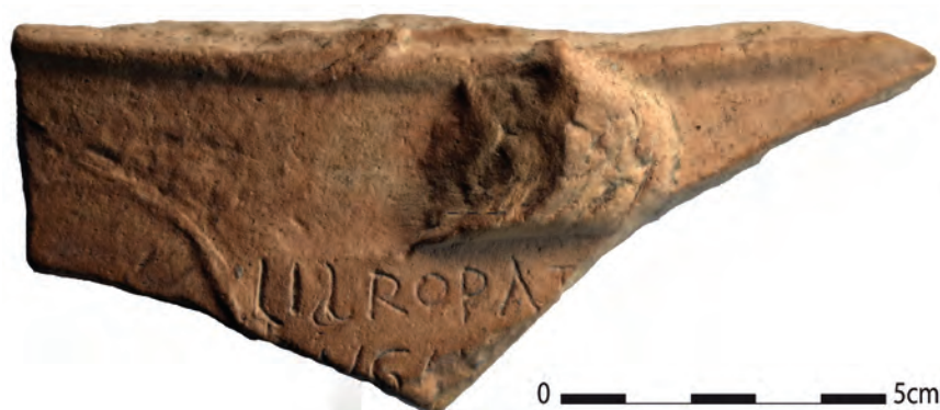
Fig. 2. Fragment de vase de Romita avec le graffite - RTI.