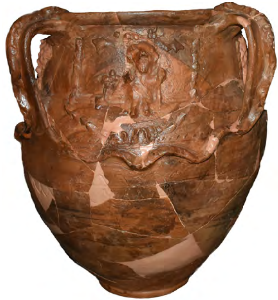
Fig. 5. Vase à motifs dionysiaques découvert dans l' area sacra de la «Terrasse des Sanctuaires» (Porolissum) (cliché D. Deac).

Toutes ces données disponibles pourraient indiquer une réalisation du vase dans des ateliers en rapport avec le culte de Liber Pater à Porolissum, alors que l'incision de la dédicace avant la cuisson montrerait la sacralisation du vase et la préméditation afin d'une utilisation dans le cadre de processions ou d'autres manifestations religieuses 29 . Puisque le vase n'a pas été découvert dans un contexte archéologique clair, nous ne pouvons que deviner le scénario sur son propriétaire ou la manière dont le vase est arrivé de Porolissum à Romita. Le plus probablement, il avait appartenu à un ou plusieurs soldats en garnison dans le camp auxiliaire de Romita, ayant honoré à un certain moment Liber Pater, dont le sanctuaire se trouvait, au niveau local, à Porolissum.