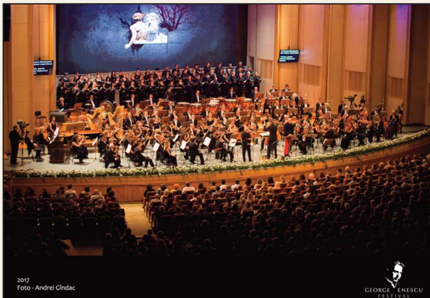
2017

În seara inaugurală a festivalului, sonurile capodoperei „Oedipe” au inundat Sala Mare a Palatului într-o interpretare de excepție, datorată London Philharmonic Orchestra și dirijorului Vladimir Jurowsky, cu