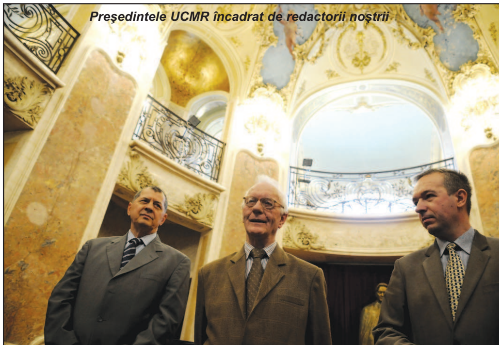
Președintele UCMR încadrat de redactorii noștri

Cum revista noastră a acordat pentru prima dată premiile sale în anul 1991, pentru 1990, înseamnă că a fost ediția a XX-a! Dar noi nu ținem la festivisme, așa cum n-am făcut, cum ar fi procedat alții, o agapă pentru a marca nr. 100 al seriei noi. Preferăm să muncim discret, servind cauză muzicii românești prin editarea singurei publicații muzicale profesioniste din România,