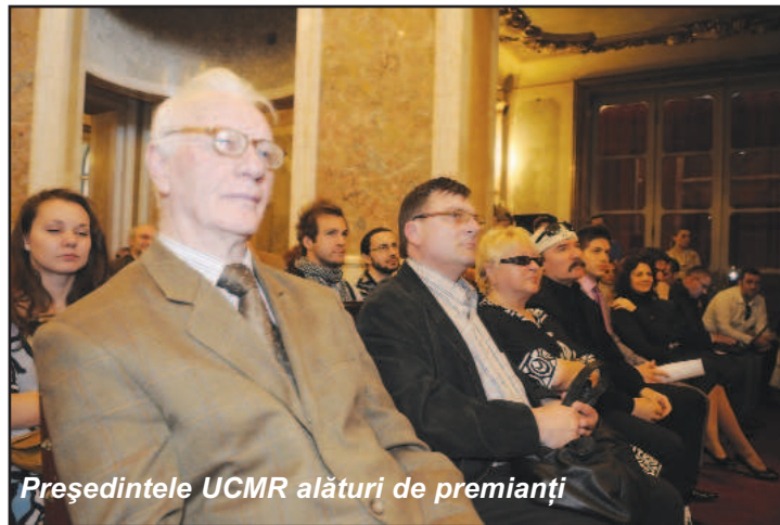
Președintele UCMR alături de premianți