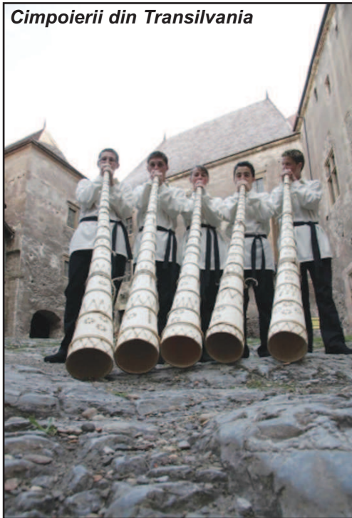
Cimpoierii din Transilvania

REVISTĂ LUNARĂ EDITATĂ DE EDITURA MUZICALĂ CU SPRIJINUL UCMR-ADA DIN FONDUL SOCIAL CULTURAL ȘI ÎN COLABORARE CU U.N.M.B.