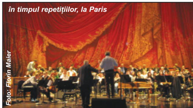
în timpul repetițiilor, la Paris

Privită prin fanta Arhetipului, piesa op. 46 funcționează bivalent, ca o întoarcere în timp, dar și ca o proiecție peste timp. Deus faber al sunetelor contemporane, György Kurtág adună în paginile Colindei-Baladă , ca într-un montaj, fragmente de eternități, probându-le coeziunea într-un univers magic, dar imperfect, în care Soarele și Luna nu se întâlnesc niciodată.