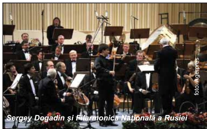
Sergey Dogadin și Filarmonica Națională a Rusiei

A consemna prin câteva cronici importanța acestui septembrie 2013, atât de complex în ce privește alcătuirea și derularea lui, este un demers destul de anevoios, pentru că, pe măsură ce începe derularea lui, rememorarea anumitor