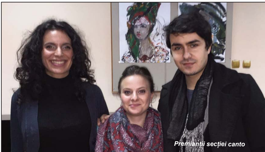
Premianții secției canto

În urma unei atente jurizări, cei mai buni dintre cei buni, au fost răsplătiți cu 74 de premii din care: 19 Premii I, 18 Premii II, 27 Premii III (corespunzător categoriilor