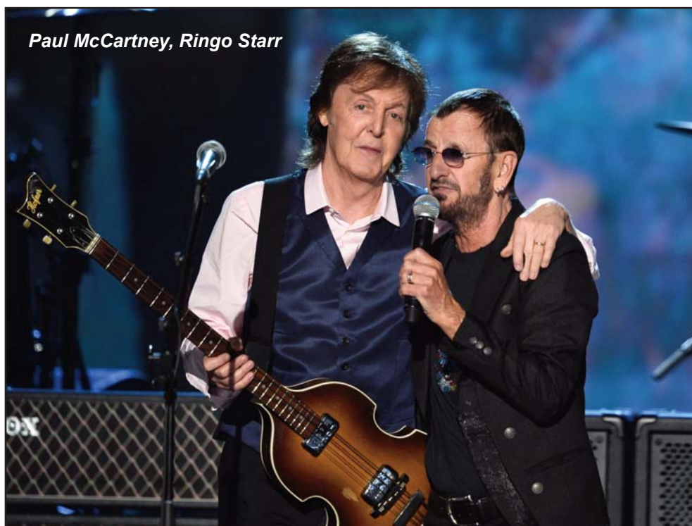
Paul McCartney, Ringo Starr

Omagiul unor artiști de primă mărime de astăzi s-a concretizat în interpretarea originală a unor piese clasice Beatles. Este vorba de "All My Loving", "Ticket to Ride" (Maroon 5), "We Can Work It Out" (Stevie Wonder), "Something" (Jeff Lynne, Joe Walsh și Dhani Harrison, fiul autorului piesei, regretatul George Harrison), "In My Life" (Ed Sheeran), "Don't Let me Down" (John Mayer, Keith Urban), "Yesterday" (Katy Perry), "Revolution" (Imagine Dragons), "Hey Bulldog" (Dave Grohl, Jeff Lynne), "The Fool on the Hill" (Eurythmics), "Let It Be" (John Legend, Alicia Keys), "Here