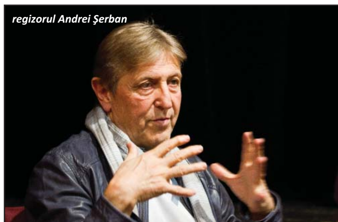
regizorul Andrei Șerban

Am avut prilejul de a urmări, în ultimul deceniu, unele aventuri spectaculare care aveau drept temă de meditație regizorală procesul de "becalizare" a societății contemporane românești. Mai demult, la Teatrul Național București, montarea beneficia, drept temă cu variațiuni, de comedia franceză Burghezului gentilom al lui Molière, în viziunea adusă la zi de regizorul român Petrică Ionescu. Mai de curând, la deschiderea stagiunii Operei Naționale București, am vizionat tot o temă cu variațiuni, aleasă acum de regizorul Andrei Șerban - opereta vieneză Văduva veselă de Franz Lehar. Numitorul comun al ambilor regizori creatori pe scene