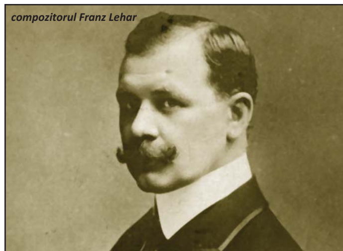
compozitorul Franz Lehar

Comentariile de fond ale reprezentației din Capitală au mai multe argumente "Pro și contra". Față de oferta sălii teatrului, corecturile de sonorizare preiau