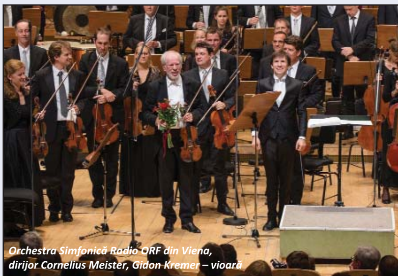
Orchestra Simfonică Radio ORF din Viena, dirijor Cornelius Meister, Gidon Kremer – vioară

Orchestra vieneză - un alt mecanism perfect articulat, cu instrumentiști rafinați și elevați, cu suflători stăpâni pe instrumentele lor, conduși de către dirijorul Cornelius Meister, foarte preocupat, la rândul-i, de respectarea sistemului ritmic asimetric, eterogen, contrastant, în special în primele două opus-uri, Inseln (Insule) de Gerald Resch și Concertul pentru vioară și orchestră al polonezului Mieczysław Weinberg. Apariția, ca solist, a faimosului violonist Gidon Kremer, acum în vârstă de 69 de ani, a augmentat altitudinea actului interpretativ în totalitate. Violonistul rus și-a creat și dezvoltat o asemenea cultură a sunetului, încât își fascinează și azi auditoriul. Kremer descinde adânc în interiorul materiei sonore, pe care o descompune în particule infinitesimale, sublimând-o. Piesa de rezistență a fost, cum se întâmplă de fiecare dată, lucrarea simfonică din final. În cazul de față, Simfonia I de Jean Sibelius. Ansamblul vienez a trecut cu brio testul eterogeneității stilistice a partiturii care, dincolo de eclectismul tipic