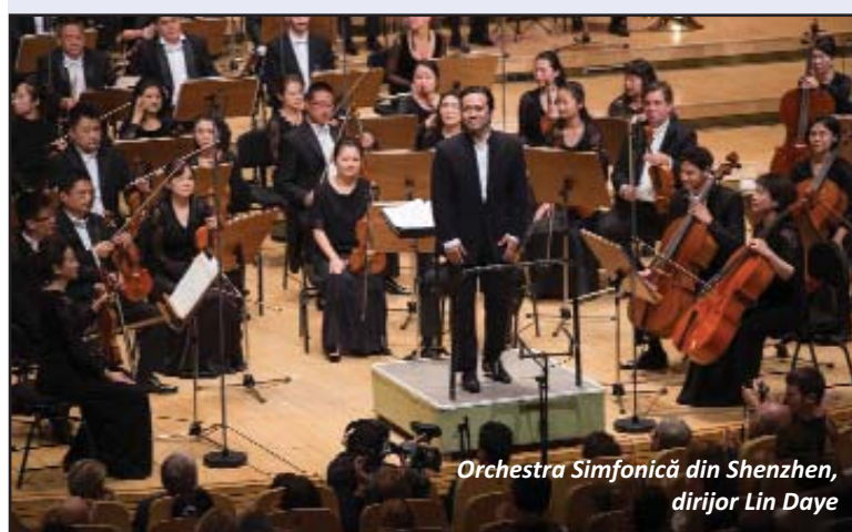
Orchestra Simfonică din Shenzhen, dirijor Lin Daye

Colosalele eforturi financiare și logistice, pe care le presupune și impune o acțiune de o asemenea anvergură, și anume transportarea la București a unor ansambluri simfonice masive, din diferite colțuri ale lumii, de data aceasta chiar din zona asiatică, împreună cu zecile de instrumente specifice fiecăruia, precum și a unui număr