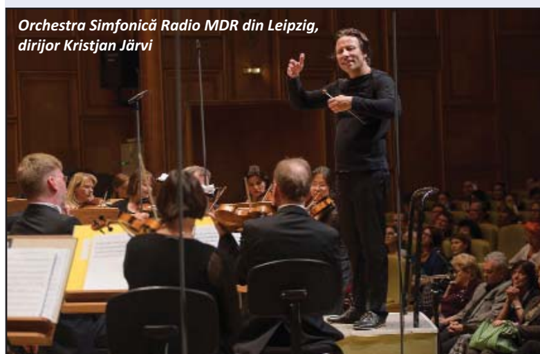
Orchestra Simfonică Radio MDR din Leipzig, dirijor Kristjan Järvi

- el fiind cunoscut drept „pianist de jazz” - în blue jeans, cămașă înflorată, adidași, păr lung prins în codiță, la spate - a format, cu Kristjan Järvi, un cuplu atipic, a cărui imagine părea să împartă scena în două secvențe temporale disparate: de o parte instrumentiștii orchestrei, în ținută sobră, „de concert”, de cealaltă parte protagoniștii în timpul unei... repetiții! Momente diferite, alăturate și unificate însă, ca într-o peliculă cinematografică, de virtuozitatea și muzicalitatea impecabile ale ambilor artiști, care au estompat până la anulare discrepanța dintre convențional și natural! În Suita din „Lacul lebedelor” , transformată într-o adevărată „simfonie dramatică”, după propria-i expresie, Järvi a fost meticolos în sugerarea fiecărei intrări a instrumentelor, s-a dezlănțuit vulcanic și s-a strecurat cu o dezinvoltură spectaculară printre ritmurile eterogene ale suitei ceaikovskiene, dovedind că are muzica în sânge și că, în sunetele, motivele, frazele în care simte că nu ar exista o poveste, e dispus să o inventeze singur, pentru a face discursul cât mai comprehensibil.