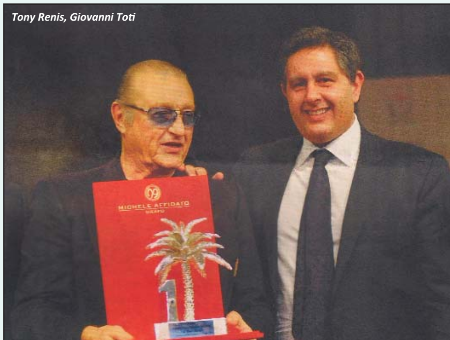
Tony Renis, Giovanni Toti