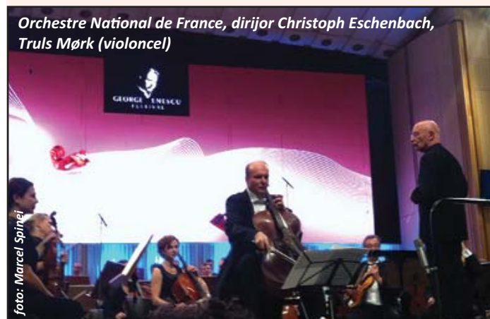
Orchestra National de France, dirijor Christoph Eschenbach, Truls Mørk (violoncel)

Trăsătura distinctivă a concertului festiv de marți 19 septembrie a.c. de la Sala Mare a Palatului a constituit-o invitatul special al serii - Orchestra National de France, Paris (fondată în 1934, parte a Radioului Național Francez), sub bagheta dirijorului Christoph Eschenbach, solist violoncelistul norvegian Truls Mørk. A fost un concert de anvergură, pretențios, cu o sala arhiplină și un public fremătător. Dirijorul Christoph Eschenbach - un pianist de talie internațională, a condus Orchestra Națională a Franței în 2000-2010; acum este director artistic al National Symphony Orchestra, J.F.Kennedy Center for the Performing Arts, USA . Concertul a debutat cu Uvertura la opera Tannhäuser , ce a răsunat profund, maiestuos, o metaforă sonoră din legenda germană, cu pasiuni mistuitoare: lupta dintre iubirea sacră și cea profană, și răscumpărarea prin iubire. Wagner folosește melodia sa infinită , pe eșafodajul sonor specific, cu care a intrat în istoria culturii muzicale. Uvertura se poate cânta și separat, și scurtată, iar cea