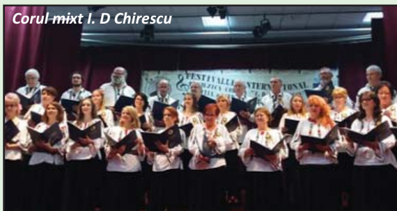
Corul mixt I. D. Chirescu