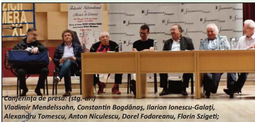
Conferința de presă: (stg.-dr.)

Ca pe o reînnoire a fost văzută și cea de-a 41-a ediție (10-14 Iulie 2018) a Festivalului Internațional al Muzicii de Cameră de la Brașov de către Directorul de Onoare al Festivalului,