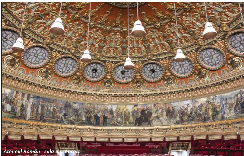
Ateneul Român - sala de concert