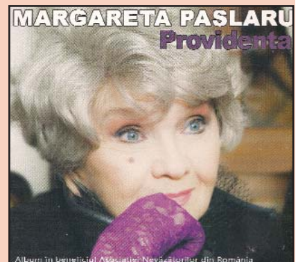
Album în beneficiul Asociației Nevăzătorilor din România