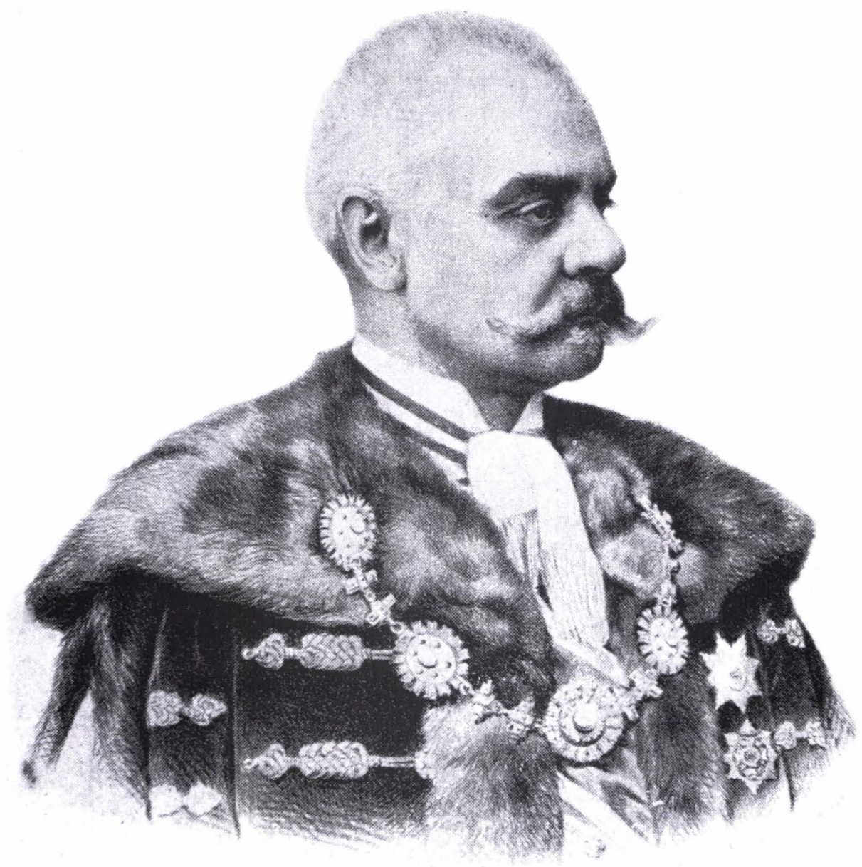
Báró Nikolics Fedor.