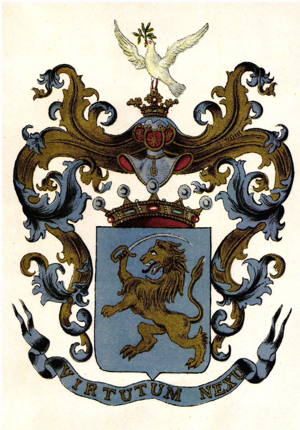
Fig. 3. Blazonul de baron al familiei Nikolics de Rudna apud Lendvai.