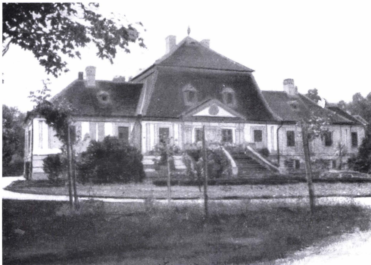
Fig. 6. Conacul familiei Nikolics din Rudna apud Borovzsky.