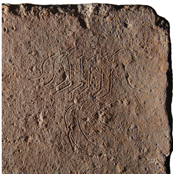
Fig. 2. Photo de détail de la brique (M. Șepețan) / Detailed photo of the brick (M. Șepețan)

La hauteur des signes, tracés ante cocturam sur deux lignes, est variable: 2,5–4,5 cm (l. 1); 3–4,5 cm (l. 2). L'indice de la bonne lecture est fourni non seulement par le C (à la place de l'abréviation pour centuria ), mais il est confirmé par la forme de plusieurs S, certains plus étirés et avec la petite barre en haut, tracée dans un deuxième temps, comme il arrive souvent dans des notations