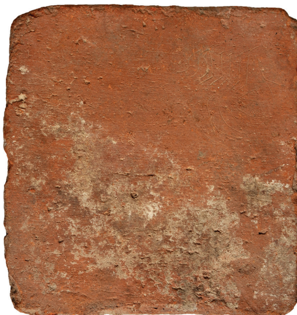
Fig. 1. Photo de la brique / Photo of the brick

En 2001 on a pu parler de la première attestation, il y a 1900 ans, de Berzovia (dép. de Caraș-Severin), toponyme cité dans le seul fragment conservé des Dacica de l'empereur Trajan 1 , en rapport avec la progression de l'armée romaine au début de la première guerre dacique (101 apr. J.-C.). Les ruines romaines de Jidovin ont été identifiées au XIX e s. comme appartenant au camp de la legio IV Felix de Berzovia. L'actuel nom du village a été donné par l'administration roumaine au début des années 1920 2 , le nom antique étant ainsi ressuscité. Quant au toponyme Jidovin, il est à mettre en rapport avec les ruines romaines, associées – ici comme ailleurs – par les traditions populaires avec les Jidovii (litt. «les Juifs») ou les «Geants» ( uriașii ) 3 , à savoir les géants de la tradition biblique, anéantis par la fureur divine.