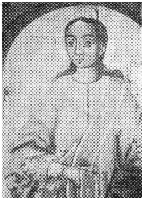
Fig. 2. George Diaconovici, Sfântă, nava bisericii de la Povergina, 1782.