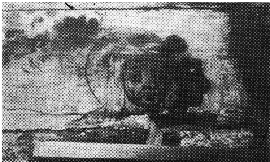
Fig. 3. George Diaconovici Arhidiaconul Laurențiu, altar, biserica de la Povergina, 1782.