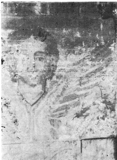
Fig. 7. George Diaconovici, Heruvim, iconostas, biserica din Bătești, 1783.

Tocmai prin aceste aspecte ale tehnicii de-a picta, prin complexitatea stilului său, George Diaconovici se înscrie pe deplin în ambianța artistică a sfârșitului de secol al XVIII-lea, caracterizată prin elementul de complexitate, neomogenă, în care tendințe diverse au încercat să se impună, iar acest reprezentant al picturii vechi românești, a știut cu un deosebit simț de discernămint, să creeze, să aleagă cele mai convenabile laturi ale uneia sau alteia dintre tendințe dînd opere de o mare frumusețe și acuratețe, impresionante pentru privitorul de azi tocmai prin perfectă simbioză, lipsită de ostentația unor elemente eterogene, lucrări destinate satelor românești, păstrătoare și iubitoare ale tradiției, ce-a însemnat în acest caz lupta pentru menținerea personalității, a limbii române, în ansamblu a tuturor manifestărilor de viață românească, vizavi de penetrația insinuantă, tenace, ce-o aminteam mai sus, a bisericii și a misionarismului catolic în Banatul aflat de la începutul secolului al XVIII-lea (1718) sub stăpînire austriacă.